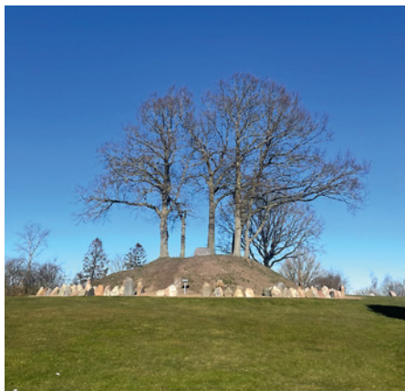
Mindehøj for de lokale, der faldt under 1. verdenskrig