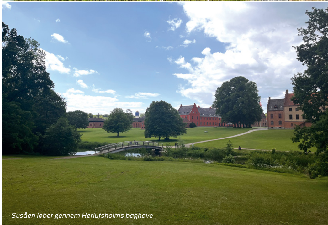
Susåen løber gennem Herlufsholms baghave