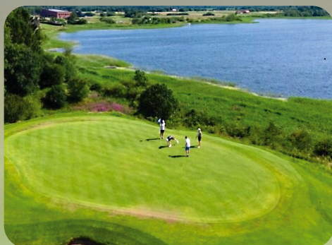
Hul 16 "Himmerland Hill"

Resortet er smukt beliggende i det kupe-rede landskab i Himmerland og byder på