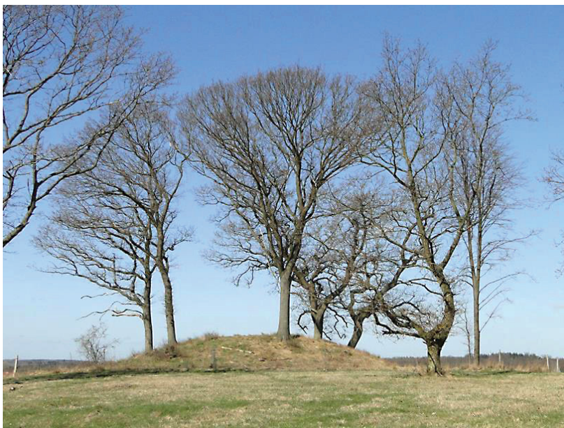
Ryget skov og Baunesletten med udsigt over Farum Sø

Turen starter fra P-pladsen beliggende efter viadukten på Bavnstedets forlængelse (1) . Bavnstedet følges igennem Baunegaarden (2) , og i fortsættelse af denne vejføring, når man ud til den lille bådebro ved Farum sø (3) , hvor man blandt andet kan se øen Klaus Nars Holm samt Farumgaard og Farum Kirke på