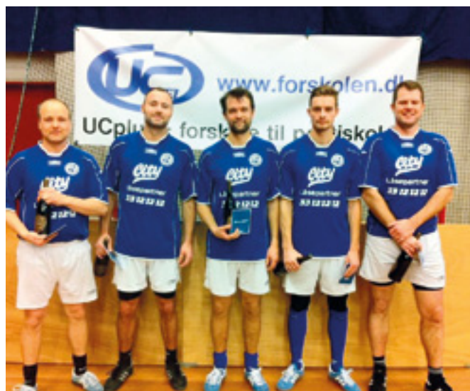
Senior 2. plads.