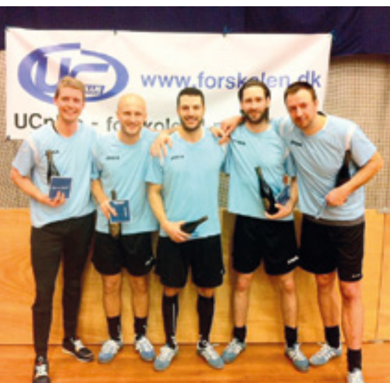
Senior 1. plads