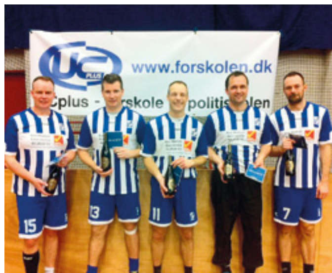
Oldboys 1. plads

Selv om det er indendørs fodbold, så kan man godt kvalificere sig til en tur med alt betalt til Dubai. Det fortæller formanden for PI-Københavns fodboldafdeling om her i forbindelse med København PI's årlige inden døre fodboldstævne.