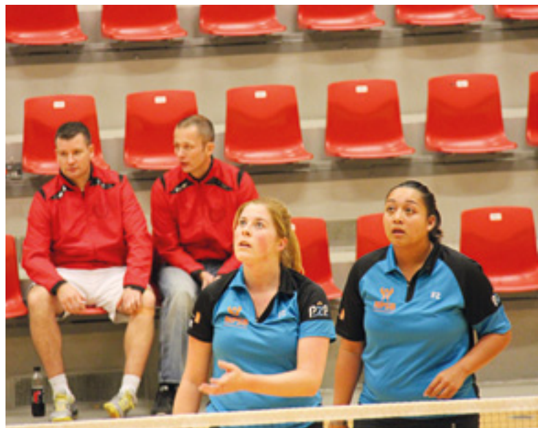
Det hollandske double par.

Efter dagens anstrengelser var der arrangeret stor middag og fest på Aalborg Politigård. Det var med et