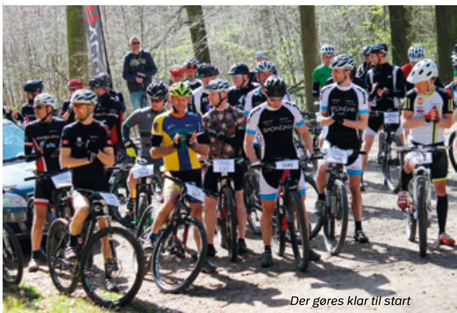
Der gøres klar til start

Der er ingen tvivl om at Horsens PI, og alle der havde del i planlægningen og udførelsen, havde lavet et kæmpe og succesfuldt arbejde. Horsens PI er en initiativrig og erfaren MTB-løbs arrangør, der har baglandet i orden. Det er altid en fornøjelse at prøve nye spor i Horsens og jeg ser også frem til at prøve en ny menu end kødgryde med pasta/ris ved fremtidige politivintercups – dette være sagt med et glimt i øjet.