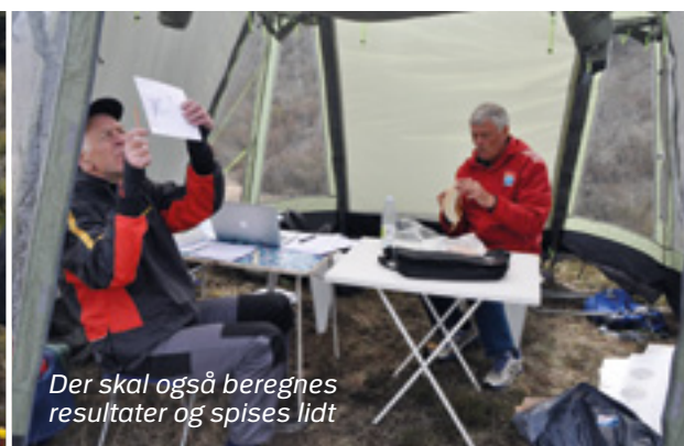
Der skal også beregnes resultater og spises lidt