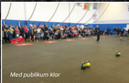
Med publikum klar