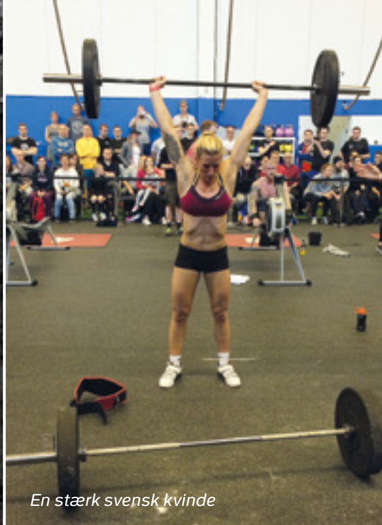
En stærk svensk kvinde

Stævnet var enormt godt planlagt, stemningen blandt de skandinaviske kollegaer var helt fantastisk og vi nød at heppe/blive heppet på af de andre danske repræsentanter fra de andre kategorier, som også klarede sig rigtig flot.