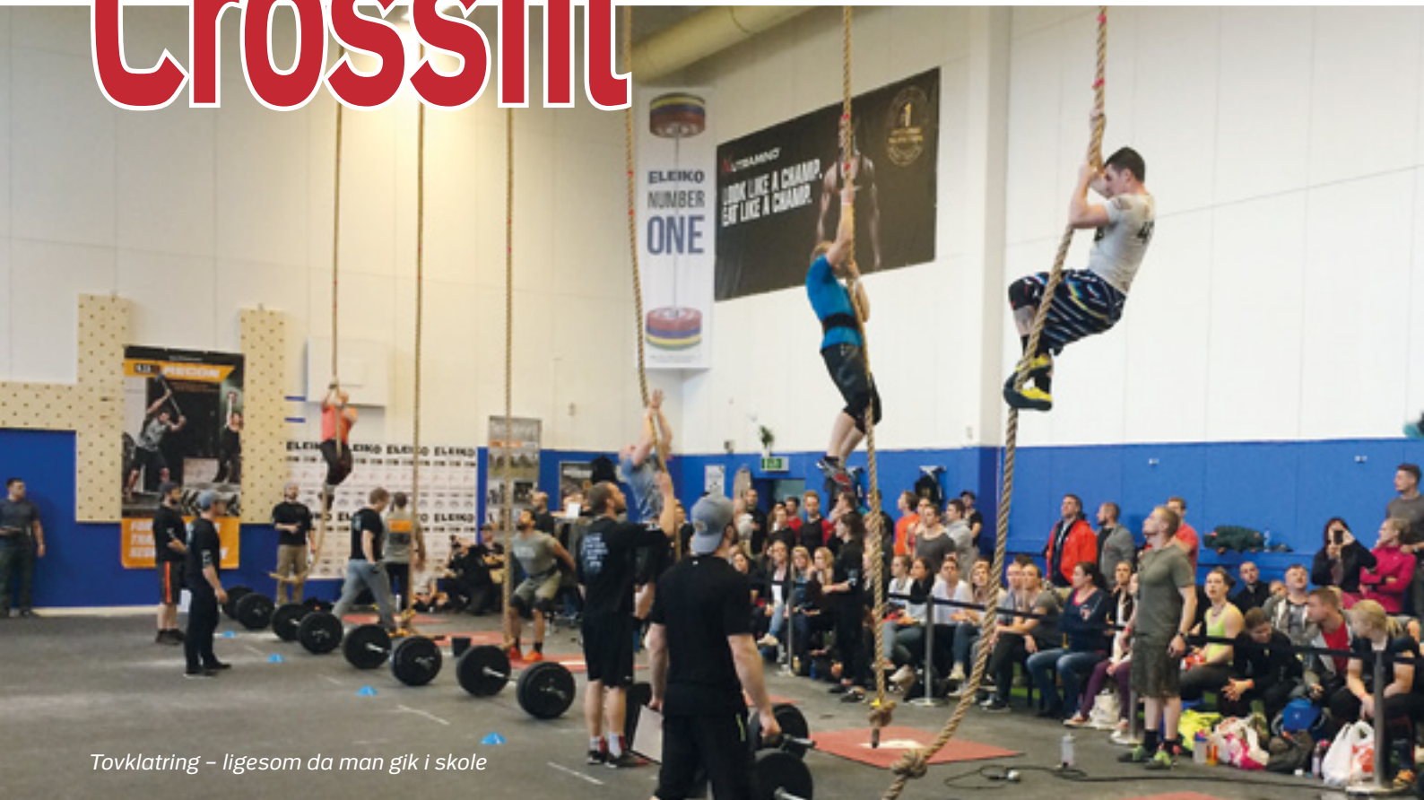
Tovklating – ligesom da man gik i skole