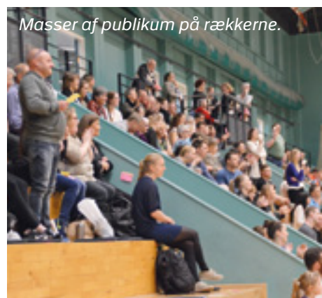
Masser af publikum på rækkerne.