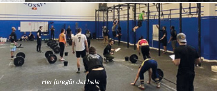
Her foregår det hele