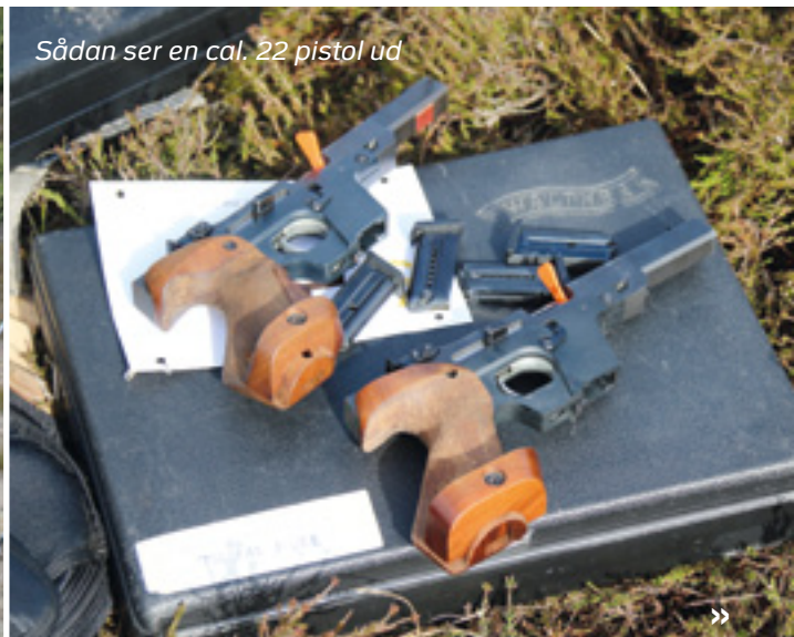
Sådan ser en cal. 22 pistol ud