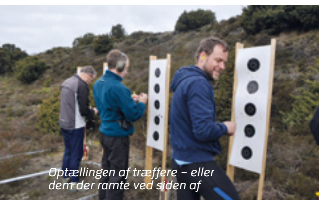
Optællingen af træffere – eller dem der ramte ved siden af

Men hvorfor er orienteringsløbet ikke til samme diskussion som feltsporner? Fordi o-løbet ikke tilnærmelsesvis kræver de samme ressourcer at afvikle, og som arrangør kan man få hjælp af lokale, civile o-klubber. Kun Forsvaret arrangerer en feltsporner, der minder om vores, men også hos Forsvaret er sporten skrantende. Og så er o-løbet også som deltager meget lettere at kaste sig ud i både for nye og gamle.