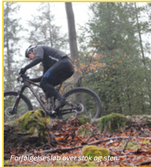
Forfølgelsesløb over stok og sten

Alt i alt endnu en god dag i og omkring de danske skove. Jeg glæder mig til flere gode oplevelser sammen med alle, der måtte have lyst til en mountainbike tur på hver sit niveau. Jeg er overbevist om, at vi kan bevare tilslutningen og gejsten, når bare vi tænker alsidighed/hensyn i planlægningsfasen.