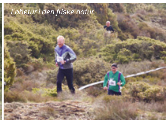
Løbetur i den friske natur