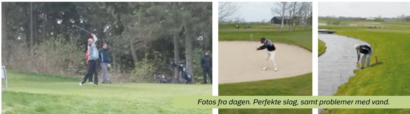
Fotos fra dagen. Perfekte slag, samt problemer med vand.

Slagelse Politi Idrætsforening havde indbudt til Sjælland Open. Vi var lidt spændte på deltagerantallet i disse afgivelsestider, men blev glædeligt overrasket over 85 tilmeldte.