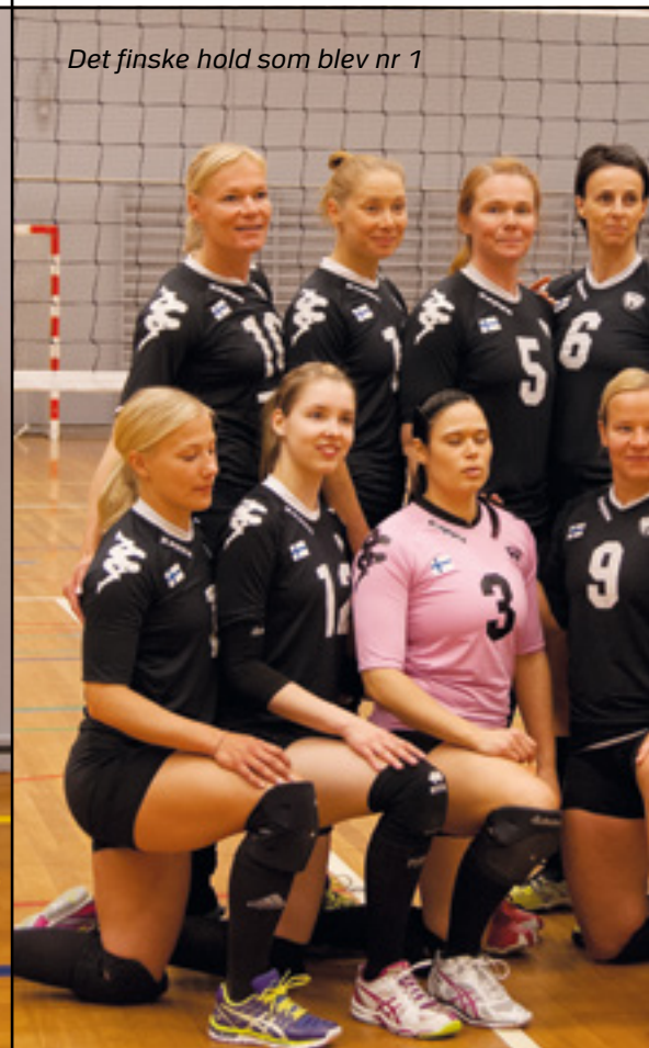
Det finske hold som blev nr 1