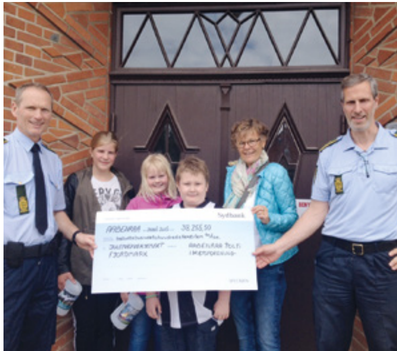
Og så kunne Aabenraa PI's bestyrelse overrække beløbet til Julemærkehjemmet.

Da vi ikke havde mulighed for at afholde arrangementet på politigårdens område, fik vi en aftale i stand med tandlægekliniken i naboejendommen, hvilket gav perfekt udsyn til politigården, der den 4. maj om aftenen havde stearinlys i alle vinduer i anledningen af Danmarks befrielse. Vi fik sponsoreret et stort telt til formålet, is, pølser, vand og sodavand fra lokale sponsorer, ligesom en lokal radio/tv forhandler stillede en computer til rådighed, således at alle i teltet kunne følge med i ro tiderne på storskærm. Vi havde besøg af julemærkebørnene med sang og