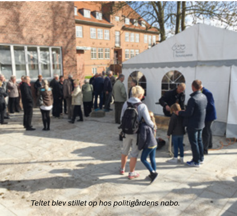
Teltet blev stillet op hos politigårdens nabo.