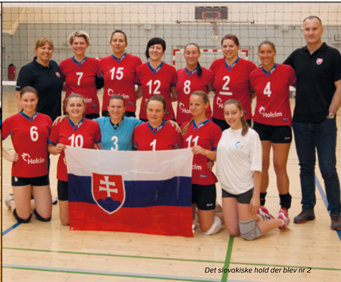
Det slovakiske hold der blev nr 2