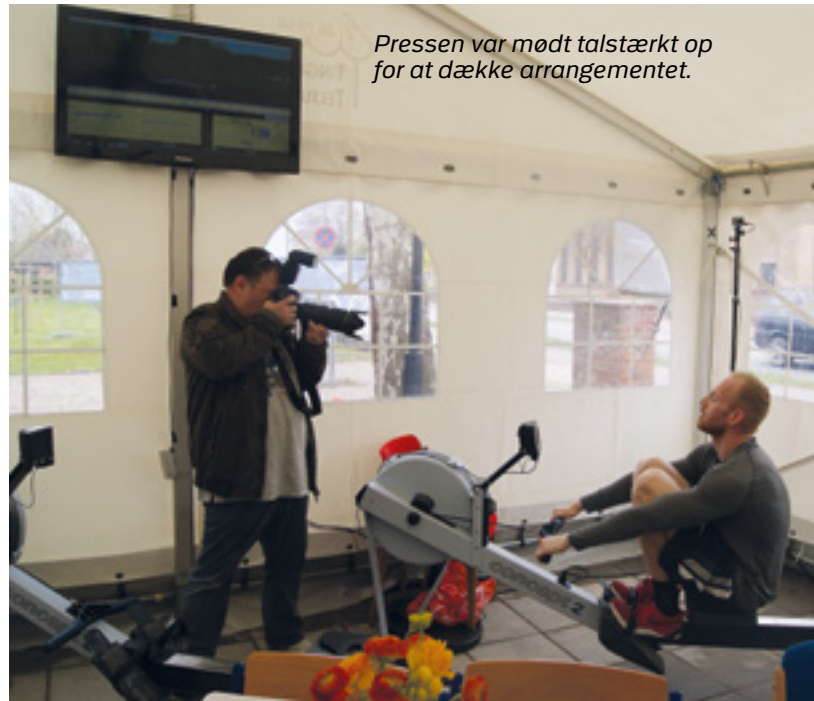
Pressen var mødt talstærkt op for at dække arrangementet.