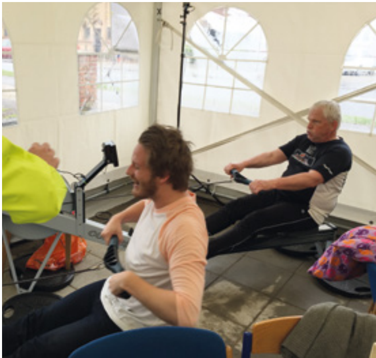
Der måtte sættes 2 romaskine ind for at alle kunne nå at give deres bidrag med.

Af Mogens Matzen, Aabenraa politi idrætsforening.