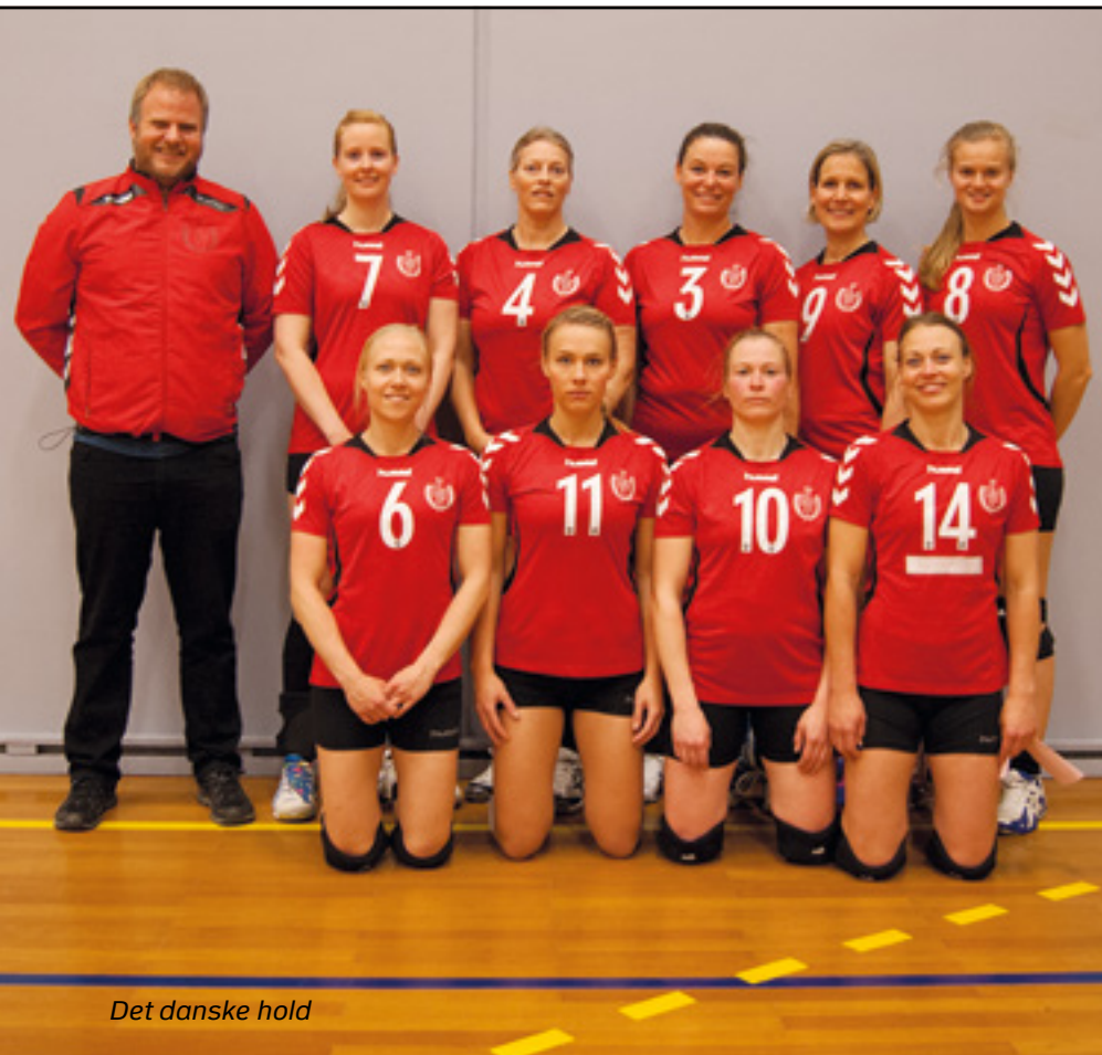
Det danske hold