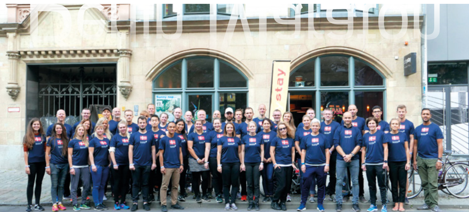
Hele holdet af både løbere og rulleskøjtøbere.