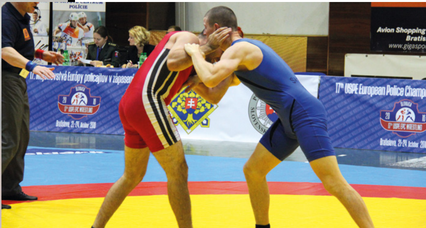
Lasse i blå trikot mod sin ungarske modstander.