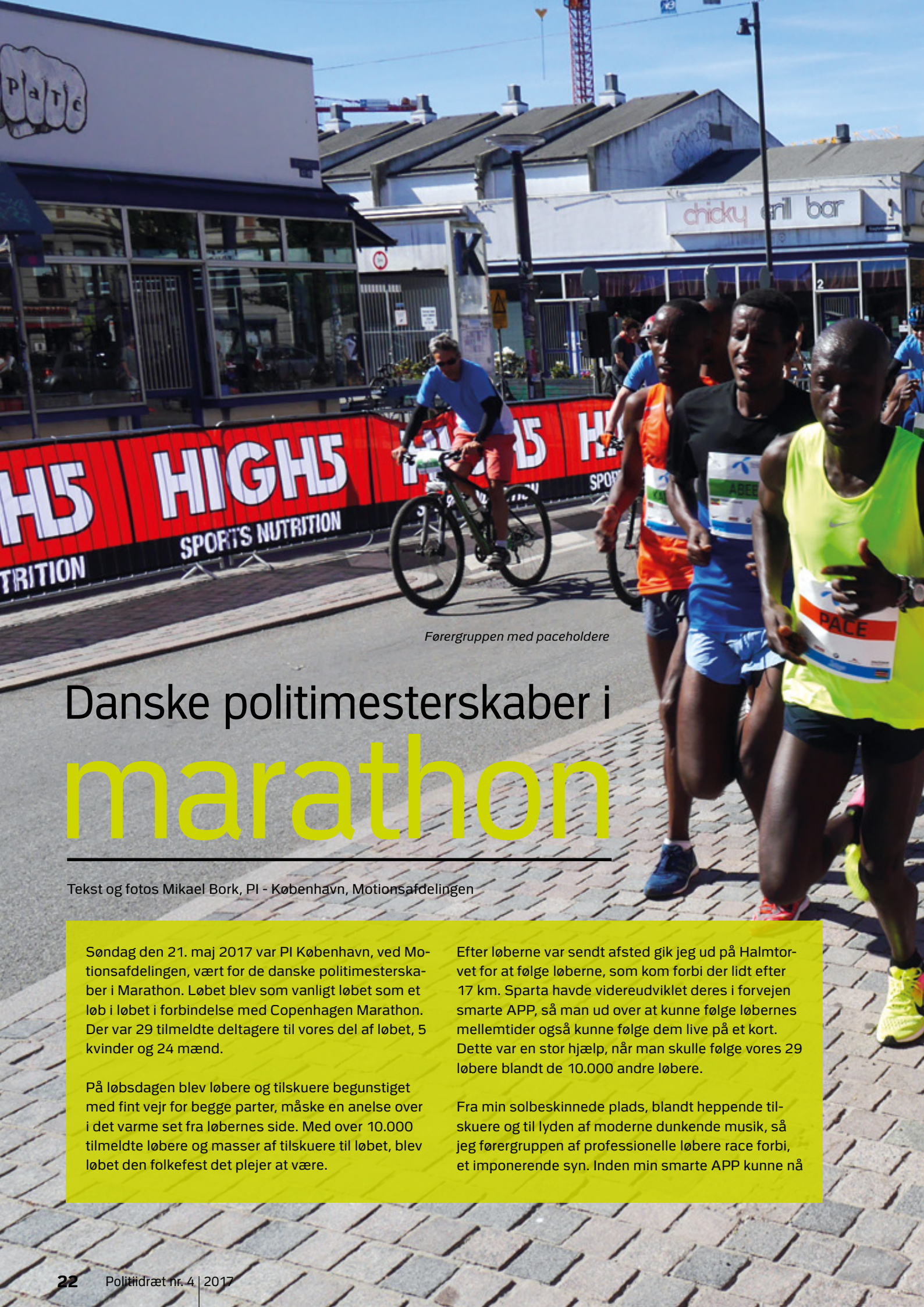
Førergruppen med paceholdere