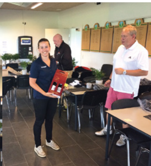
Artiklens forfatter og vinder af bedste bruttoscore