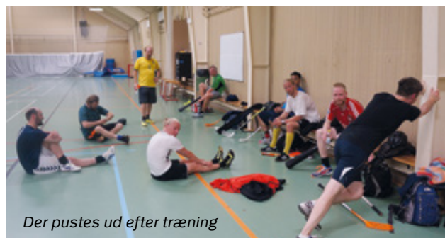
Der pustes ud efter træning