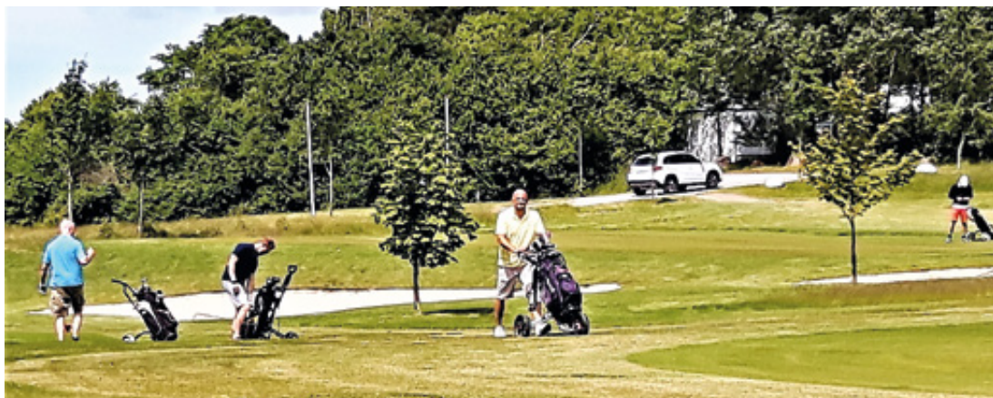
Flere af de øvrige deltagere