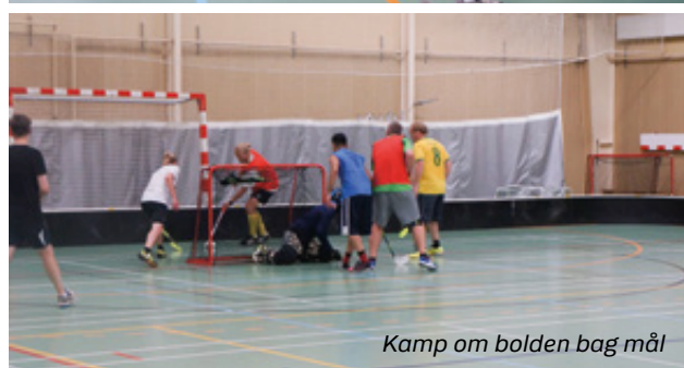
Kamp om bolden bag mål