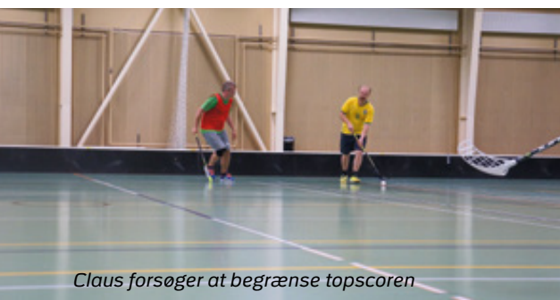
Claus forsøger at begrænse topscoren