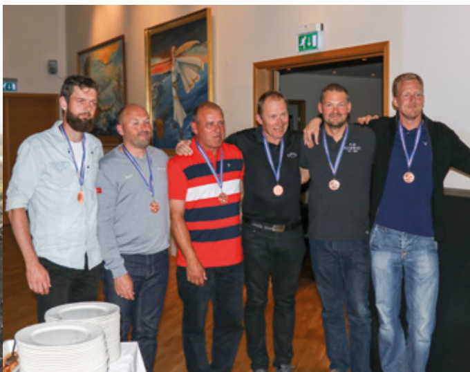
Danmarks herrer får overrakt bronzemedaljer i holdmesterskabet.