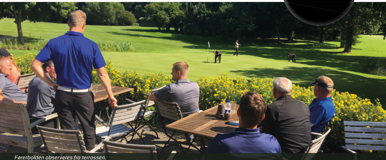
Førebalden observeres fra terrassen.

Se resultatlisten på www.politispport.dk