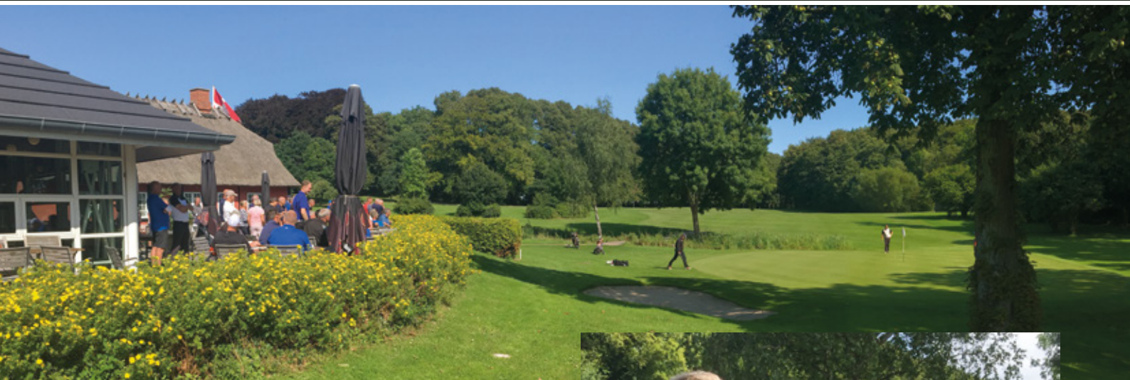
Førerbolden observeres fra terrassen.

Slagelse PI og Sydsjælland- og Lolland Falster PI afholdt, mandag den 21. og tirsdag den 22. august 2017, de danske politimesterskaber i golf på Korsørs golfklubs gamle parkbane. En bane som de fleste havde spillet, senest ved Sjælland Open den 5. maj. Der var tilmeldt 21 i mesterrækken, 9 i damerækken og 50 i A-rækken. Et meget tilfredsstillende antal. Der blev budt velkommen af Slagelses borgmester Steen Knuth. Slagelse kommune havde udlovet en præmie til hul in one i form af en jernmodel af Storebæltsbroen. Den blev dog ikke uddelt.