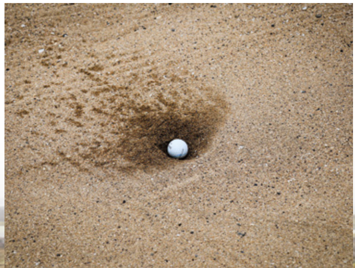
søpapegøjeæg? - næ, en golfbold i bunker.