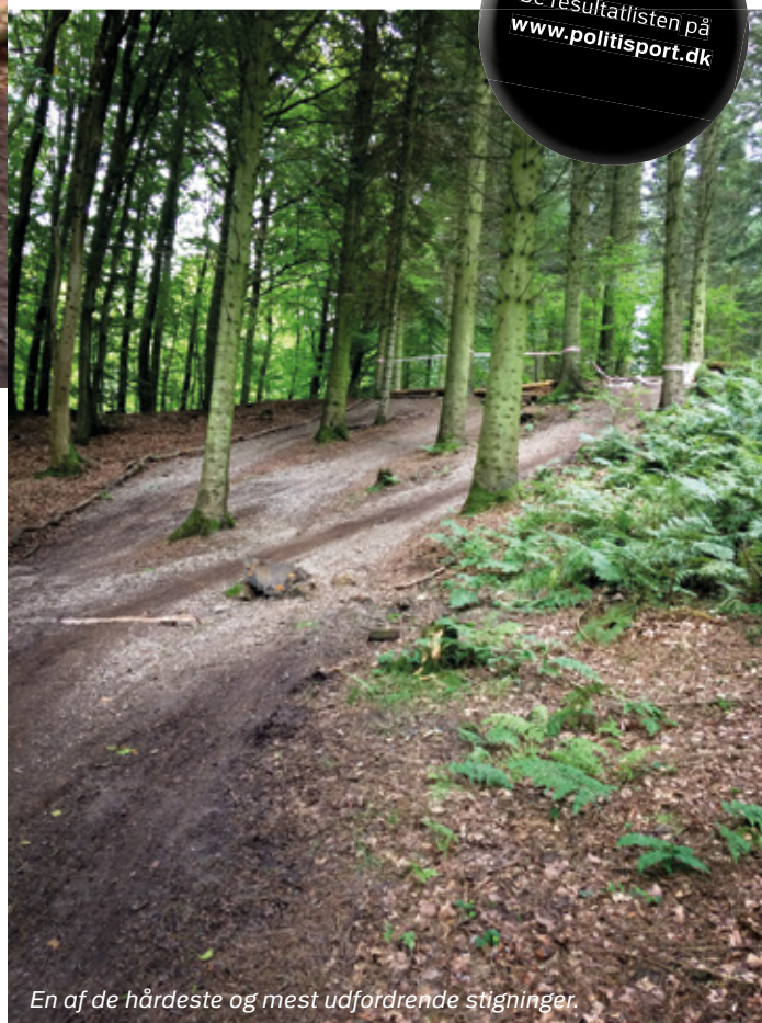
En af de hårdeste og mest udfordrende stigninger.

I alt var der tilmeldt 42 ryttere, som kom fra både politi-idrætsforeninger og civile foreninger.