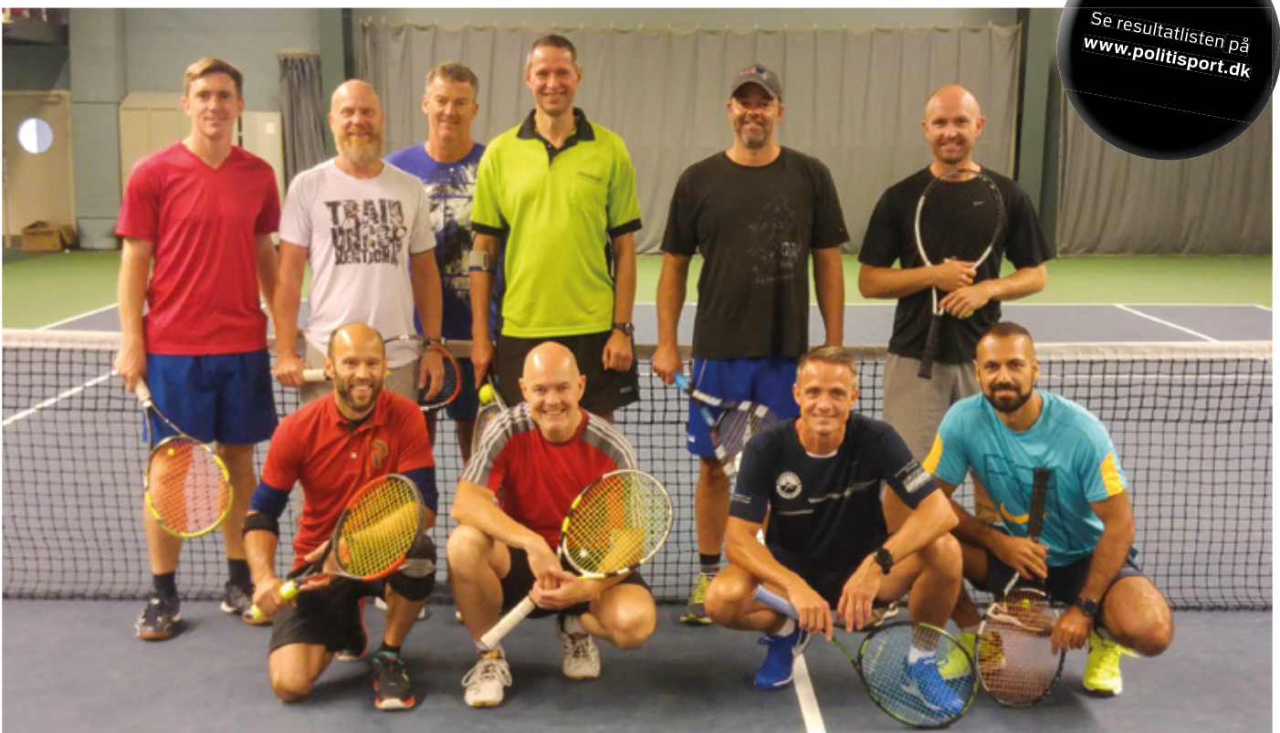
Alle deltagere til Lån og Spar Bank Cup i Kolding.

En stor tak skal lyde til Allshirts.dk, som havde en stand med gode tilbud og kyndig vejledning til deltagere og til Lån & Spar Bank som hovedsponsor samt selvfølgelig Dansk Politidrætsforbund.