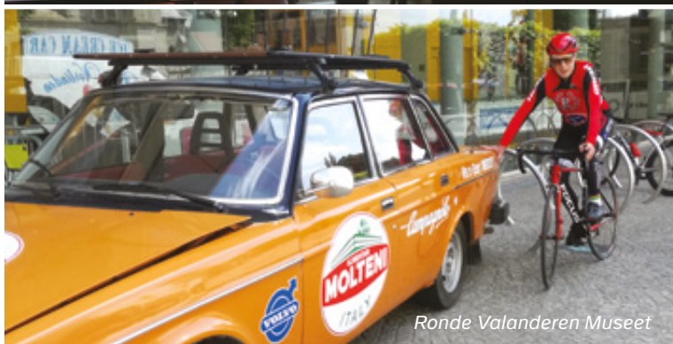
Ronde Valanderen Museet