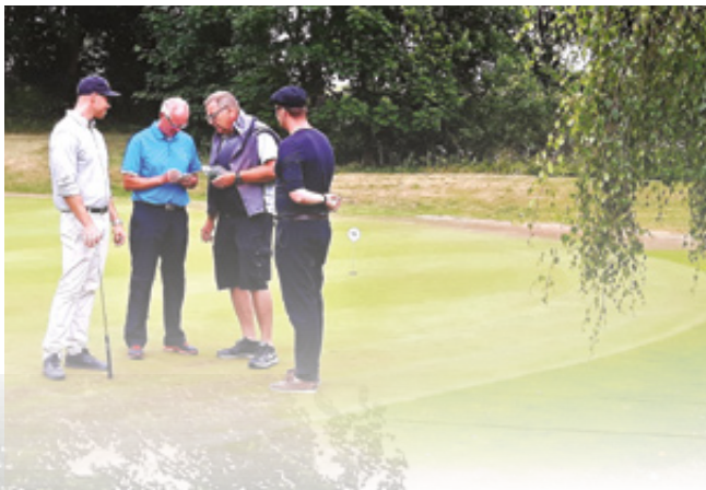
Der tælles slag for at finde vinderen i "puttekonkurrencen"