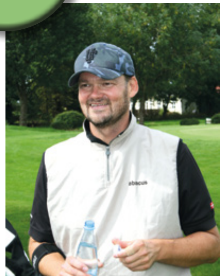
Artiklens forfatter med højt humør inden 1. runde.