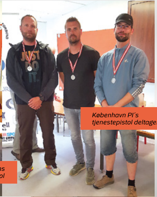
København PI's tjenestepistol deltagere