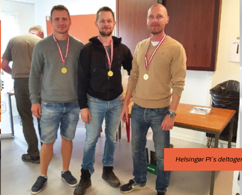
Helsingør PI's deltagere

Faldmålsfinaleskydningerne var igen i år særdeles seværdige – særligt de afsluttende shootouts om guld, sølv og bronzemedaljerne, (hvor der skydes bedst af 5 omgange), var meget spændende.