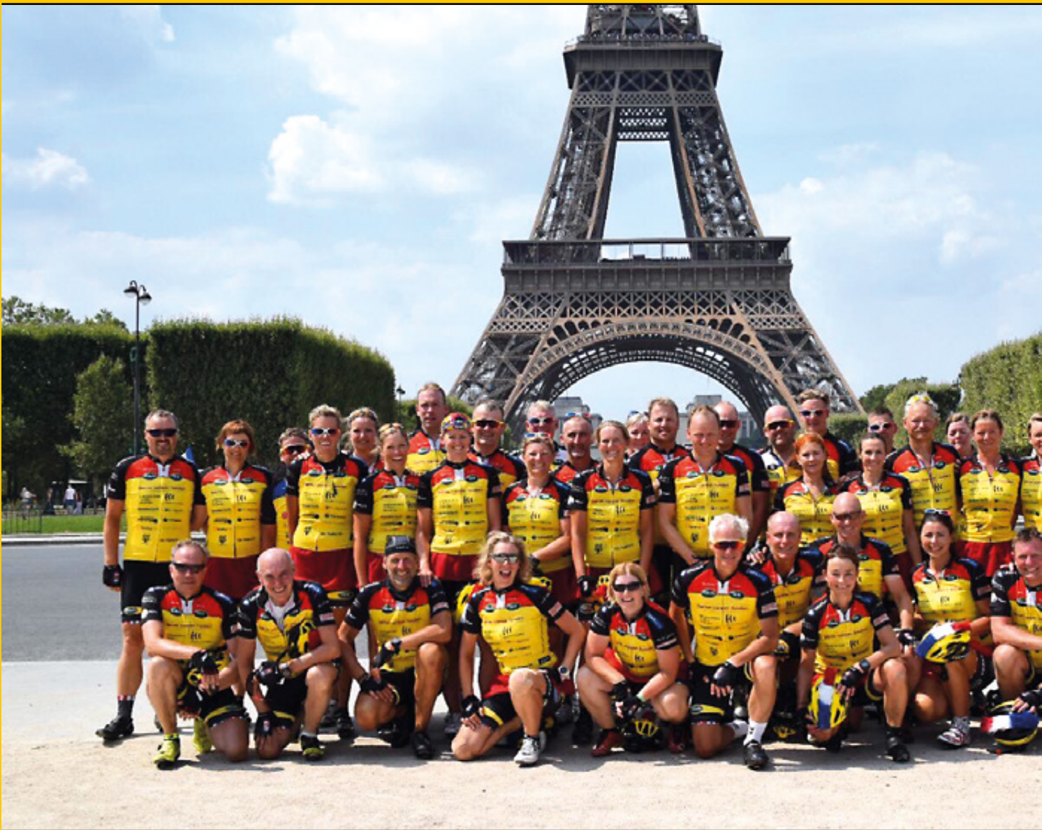
Hele holdet foran Eiffeltårnet.