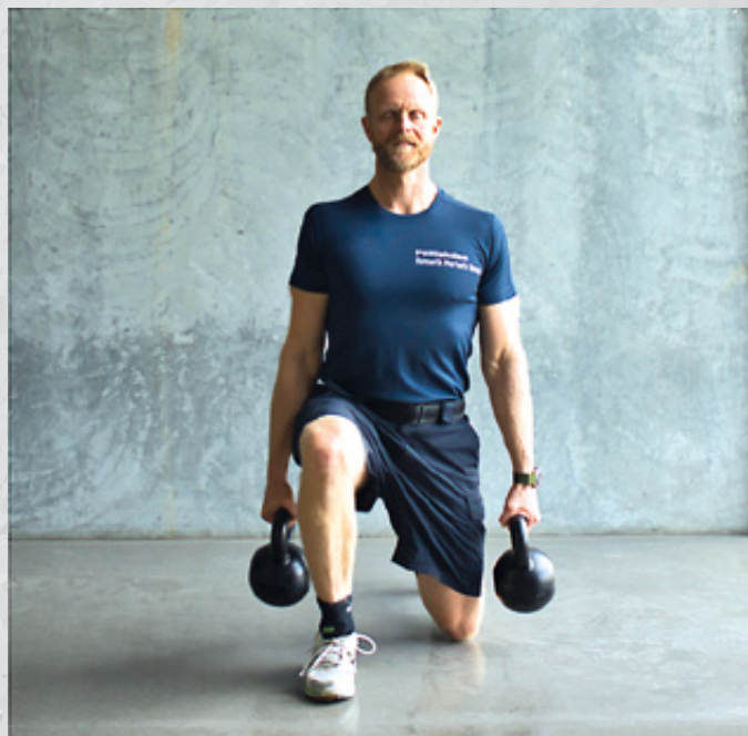
Fremfald top- og bundposition fra siden og forfra