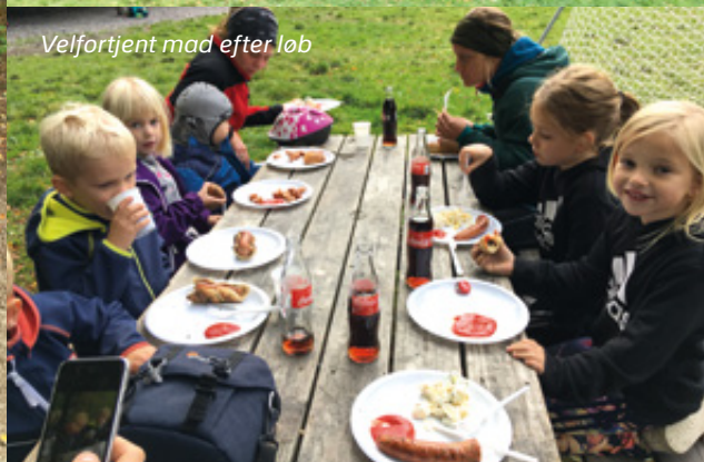
Velfortjent mad efter løb