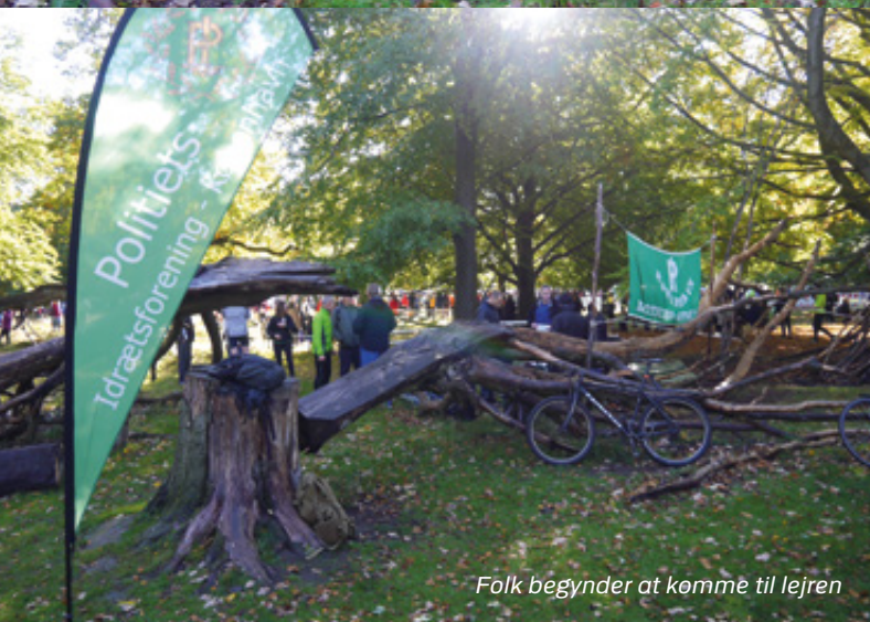
Folk begynder at komme til lejren