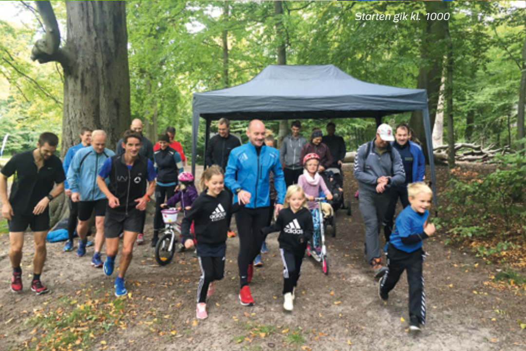
Starten gik kl. 1000