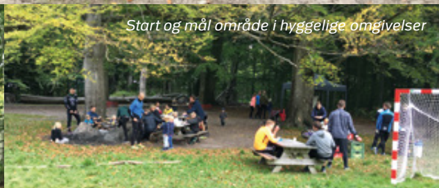
Start og mål område i hyggelige omgivelser