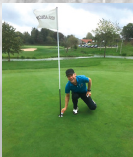
Hole in one

Fortvivl aldrig. Golf er et spil, der ikke kan vindes, men kun spilles. (Harry Vardon, 6 gange vinder af The Open Championship)