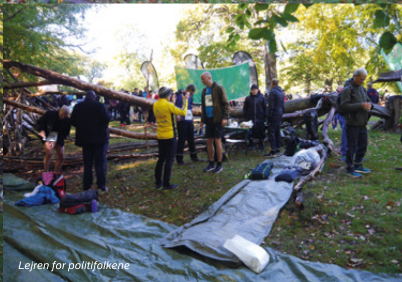
Lejren for politifolkene