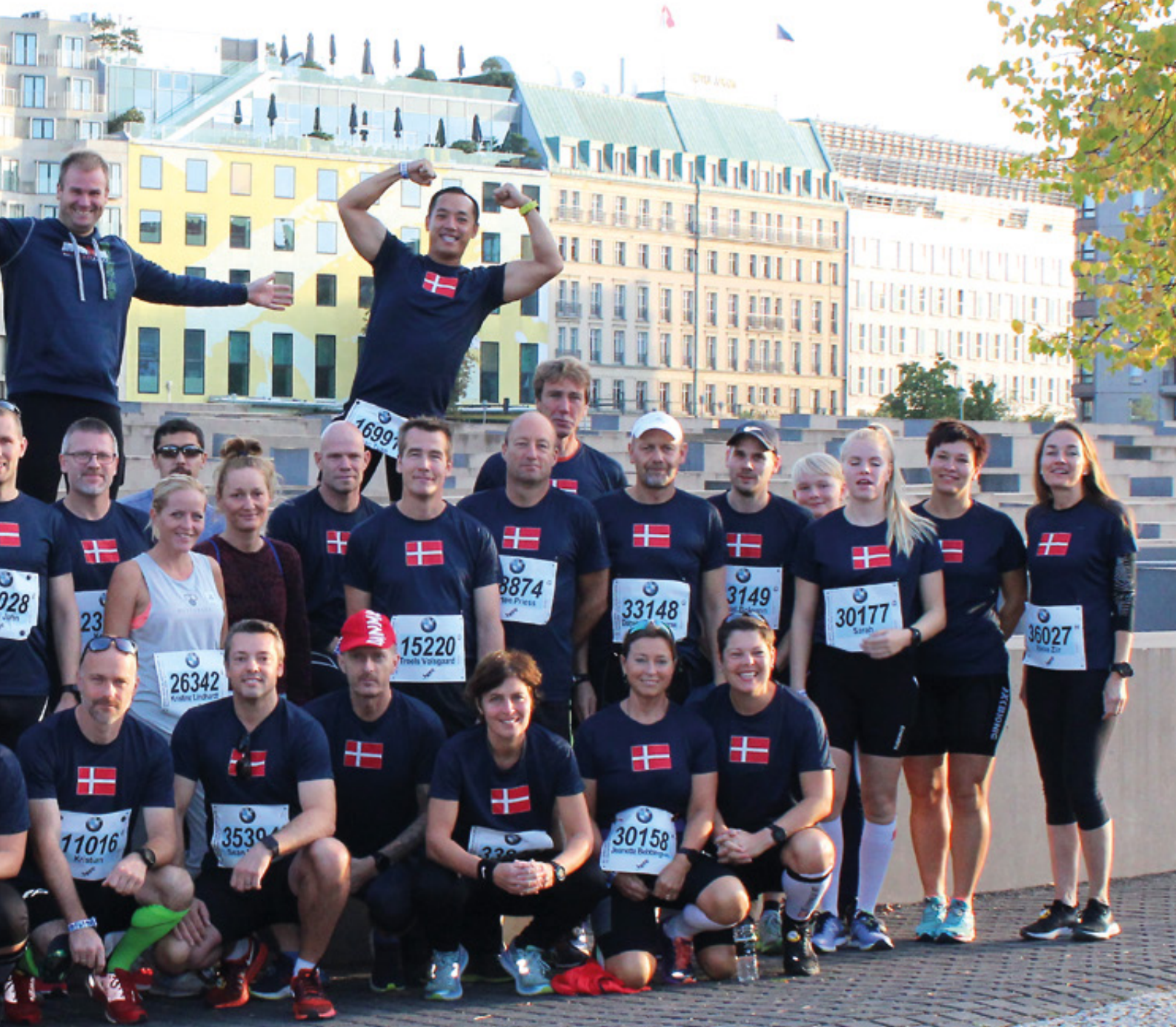
Alle deltagerne i Berlin