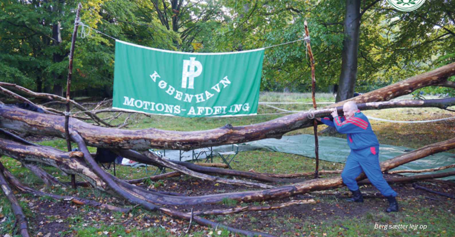
Berg sætter lejr op