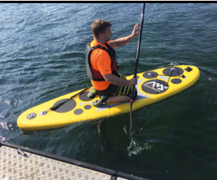
Klar til sæsonstart