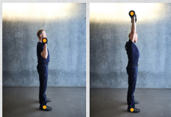
Billede 3 og 4 Billederne viser bund- og topposition set fra siden

optage det for at få noget teknisk feedback. Det er med til at sikre, at teknikken er i orden, inden du løfter tungere og kan dermed være med til at forebygge akutte- og/eller overbelastningsskader.