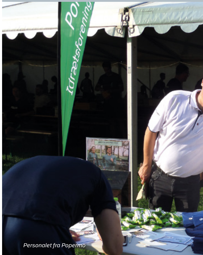
Personalet fra Popermo