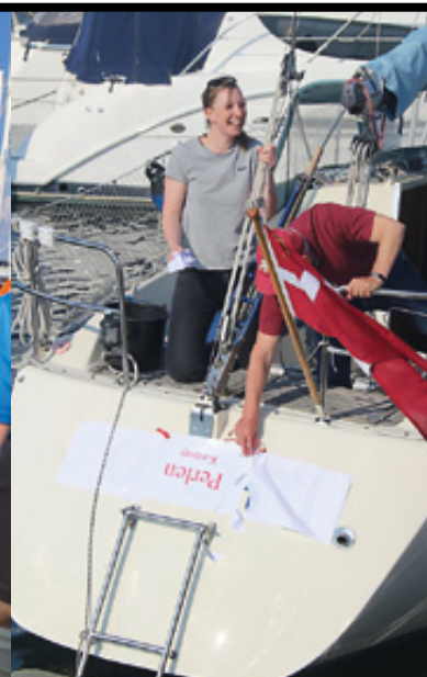
Hygge ved standerhejsning

Tekst og foto Ivar Brochorst Christensen, PI-København