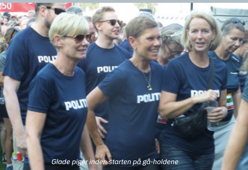
Glade piger inden starten på gå-holdene