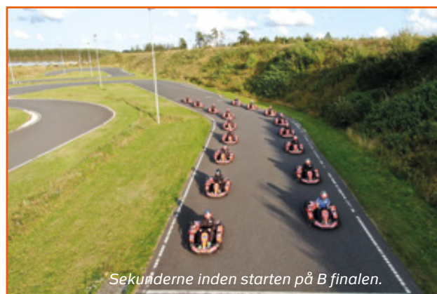
Sekunderne inden starten på B finalen.