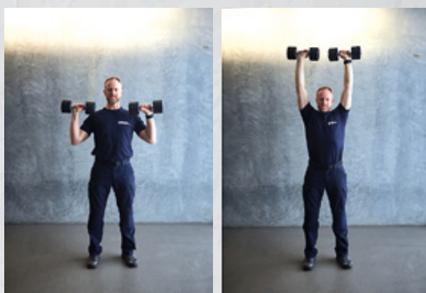
Billede 1 og 2 Billederne viser bund- og topposition set forfra

Hvis det er lang tid siden, at du har brugt pres over hovedet med håndvægte i dit træningsprogram, kan du opleve en hurtig fremgang. Vi anbefaler, at du starter med en let vægt, og langsomt øger vægten i takt med at dit tekniske niveau og din styrke forbedres. Få eventuelt en mere erfaren løfter til at kigge på dit løft eller