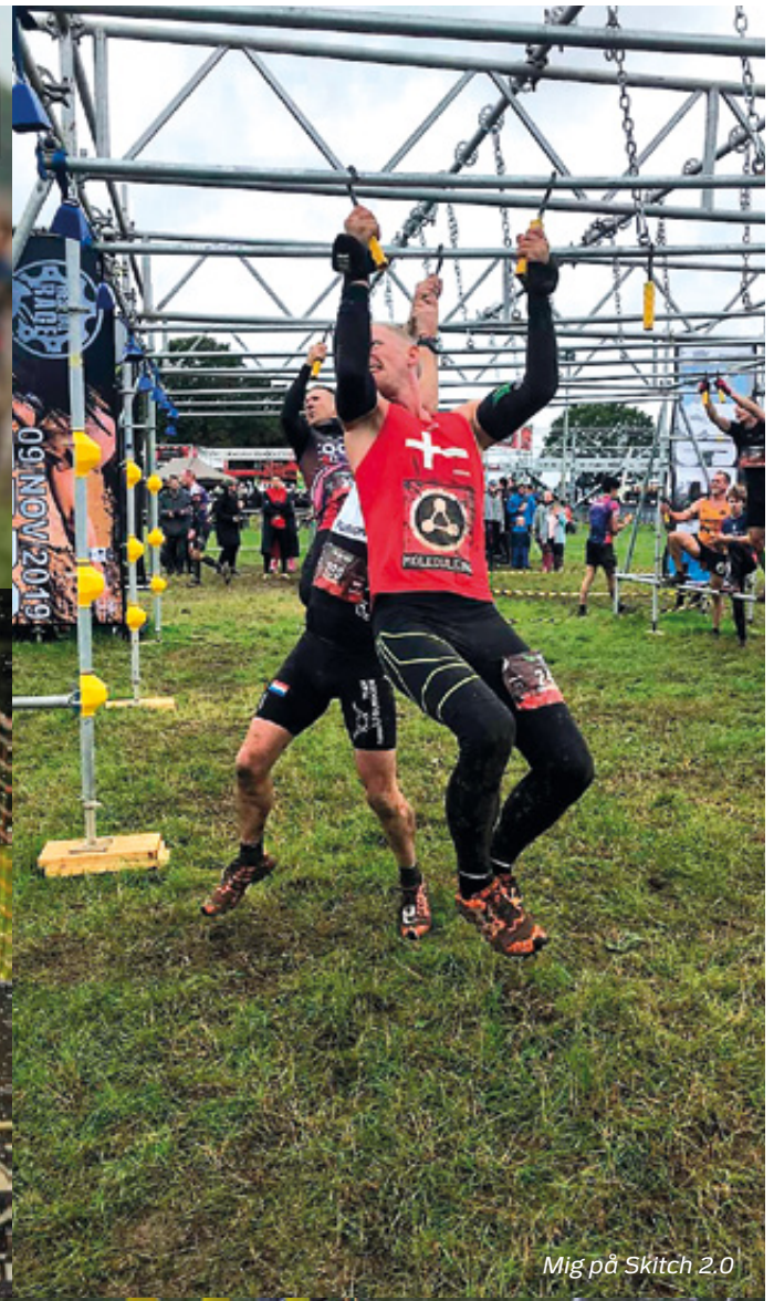
Mig på Skitch 2.0