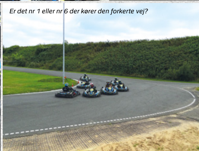
Er det nr 1 eller nr 6 der kører den forkerte vej?