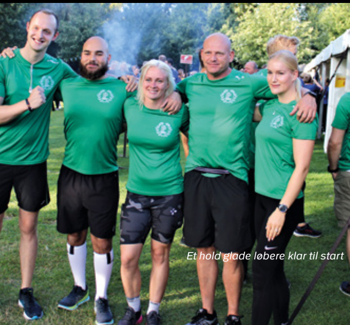
Et hold glade løbere klar til start

Det var en flok glade PI'ere, der blev sendt afsted på den 5 km. lange gåtur, som man går i samlet flok, og der blev garanteret grin hele vejen.