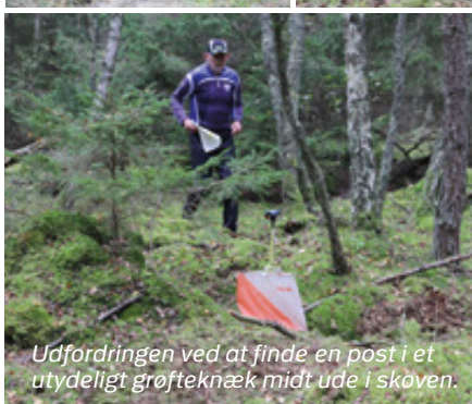
Udfordringen ved at finde en post i et utydeligt grøfteknæk midt ude i skoven.