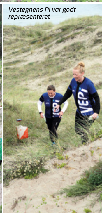
Vestegnens PI var godt repræsenteret