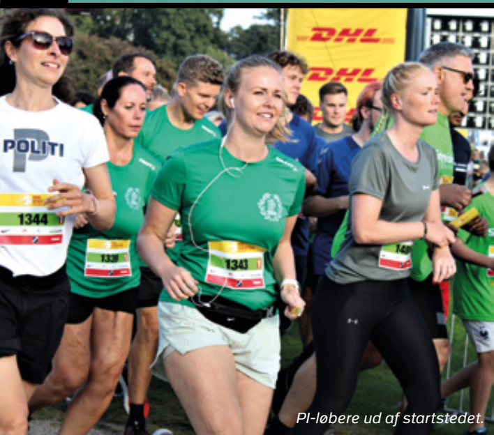
PI-løbere ud af startstedet.