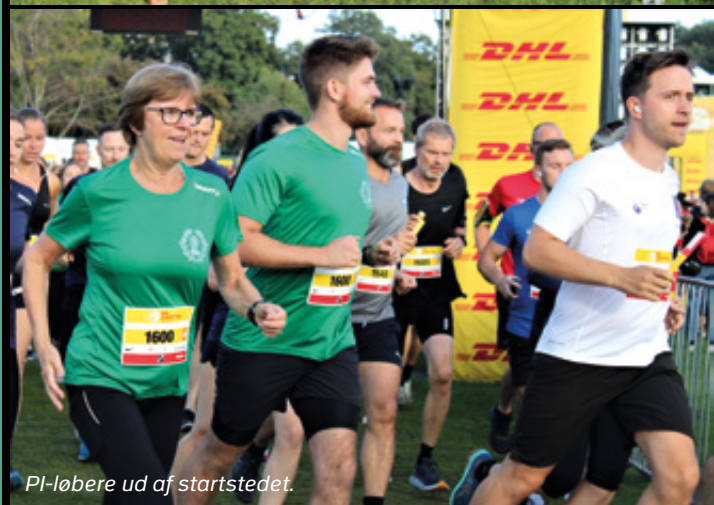
PI-løbere ud af startstedet.