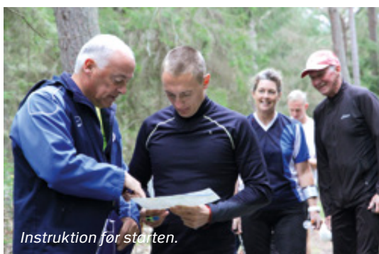
Instruktion for starten.