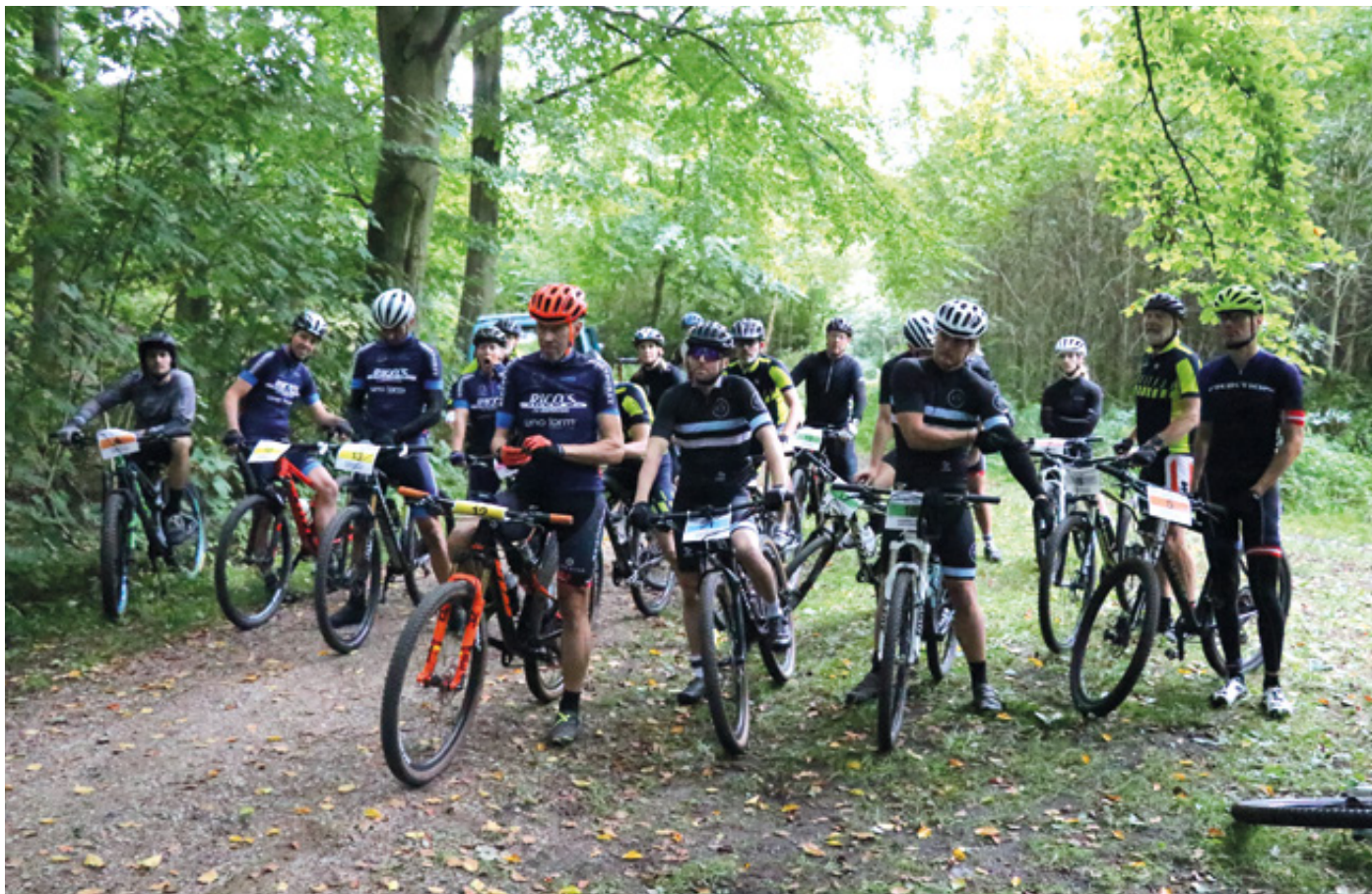
Feltet klar til start