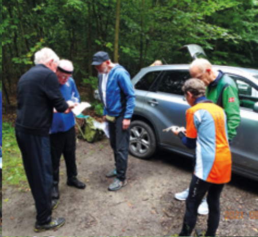
Der diskuteres vejvalg efter løbet.