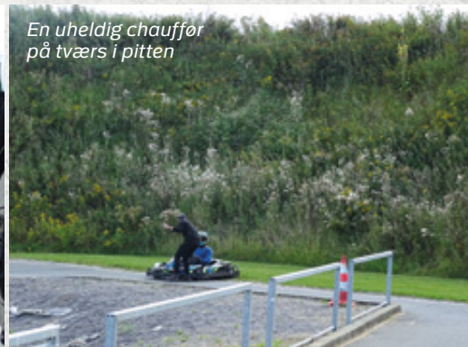
En uheldig chauffør på tværs i pitten