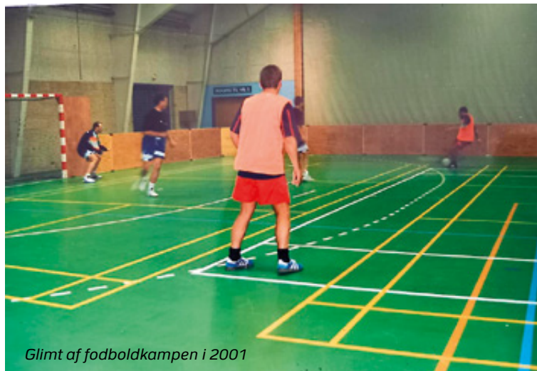
Glimt af fodboldkampen i 2001

Fredericia Politi – det må være dem i de blå trøjer med Politi på ryggen?