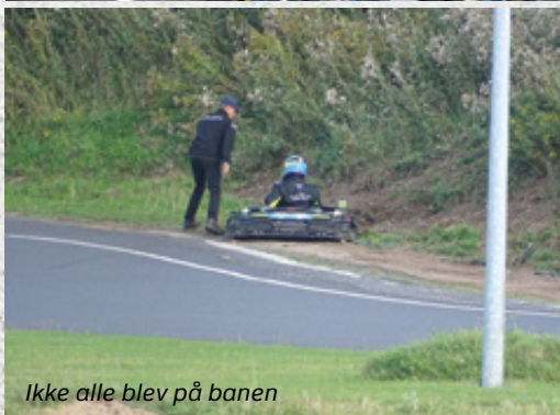
Ikke alle blev på banen