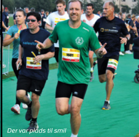
Der var plads til smil