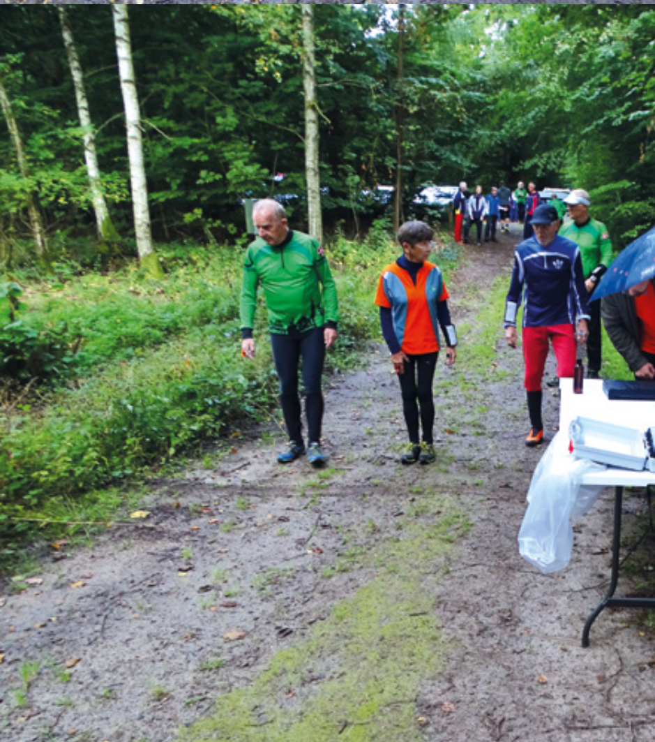
Fremkald til start. Det regnede lidt til at begynde med.