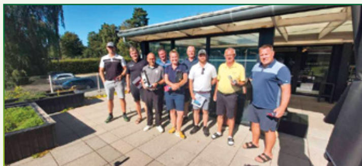
Alle vinderne, som ses på fotoet, ønskes tillykke.

Stor tak skal lyde til vore sponsorer Ludv. Bjørne Vinhandel og Formanden for Parken for loungeadgang til FCK hjemmekamp i kampen mod PAOK for 4 personer.