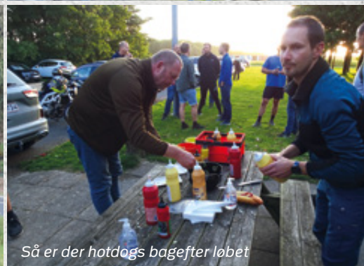
Så er der hotdogs bagefter løbet