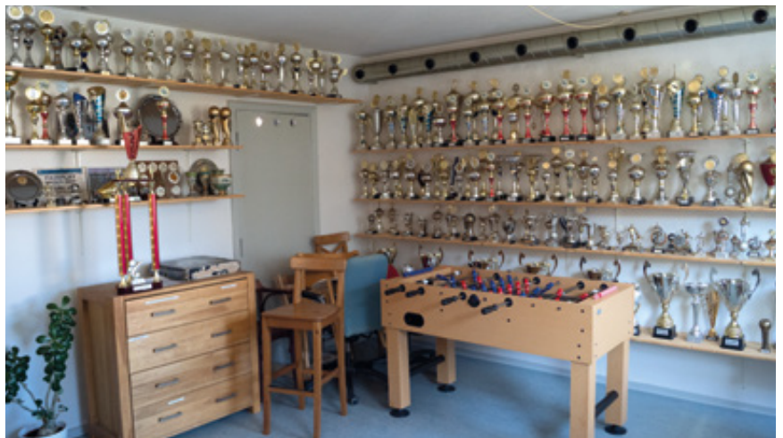
Solstrålens pokalhylder i dag anno 2021 vidner om adskillige sejre i tidens løb