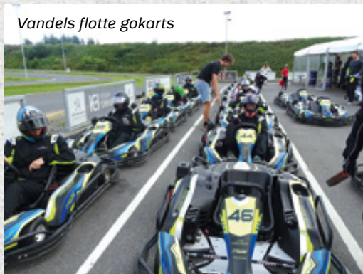
Vandels flotte gokarts