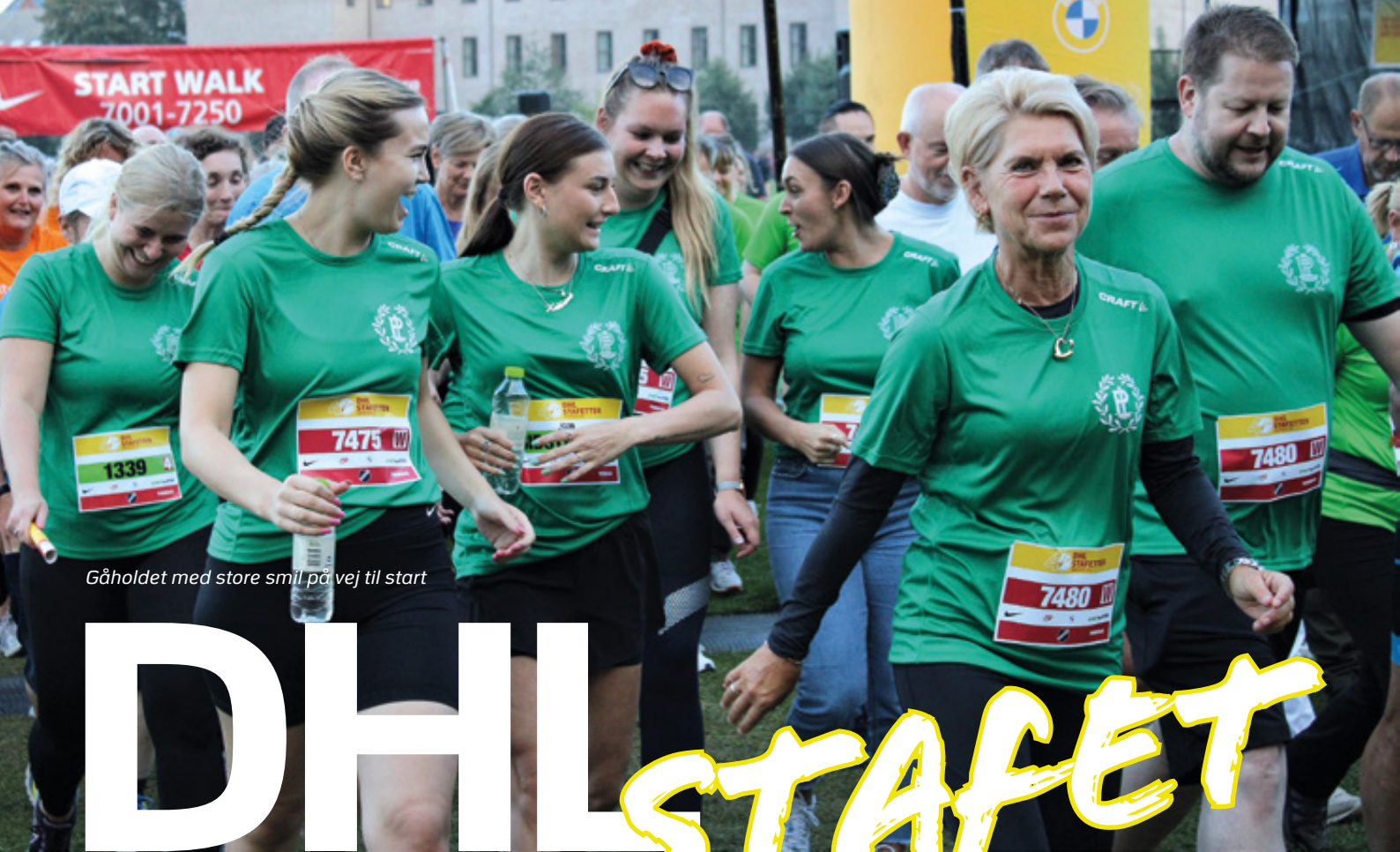
Gåholdet med store smil på vej til start