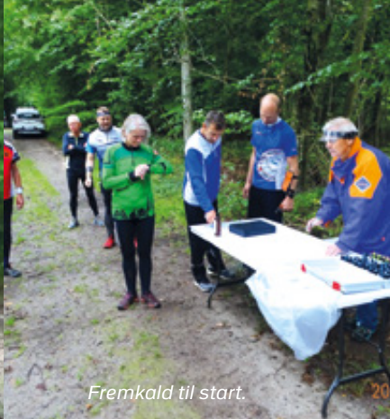
Fremkald til start.