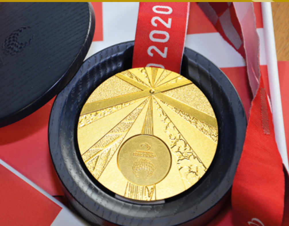
Sådan ser en guldmedalje ud