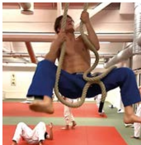
Morgan kravler i reb