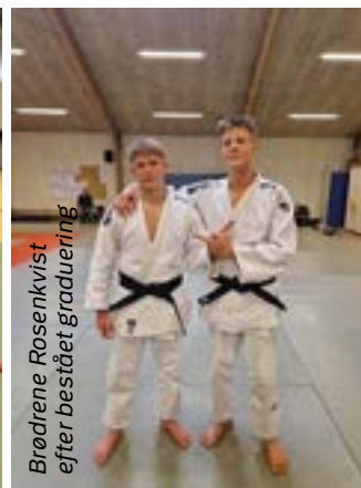
Brødrene Rosenkvist efter bestået graduering