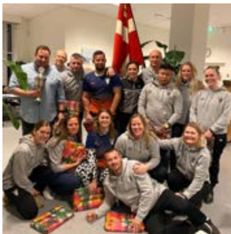
Badminton modtog holdpokalen

DU KAN LÆSE HELE REFERATET FRA GENERALFORSAMLINGEN PÅ HJEMMESIDEN UNDER HISTORIE -GENERALFORSAMLING - 2022