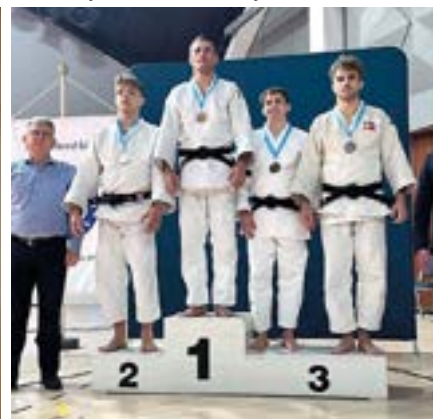
Anders får bronzemedalje