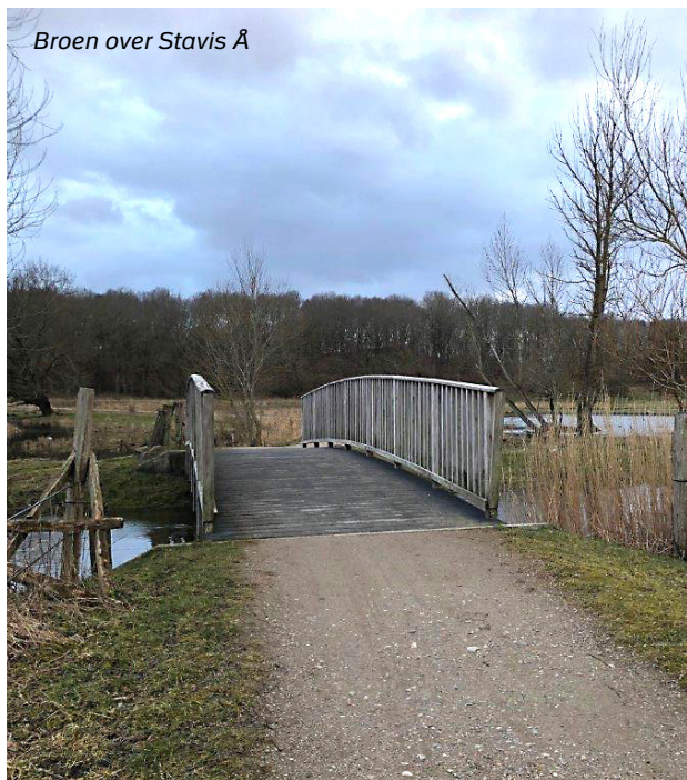
Broen over Stavis Å