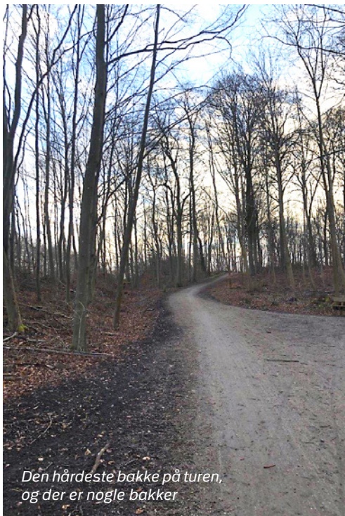
Den hårdeste bakke på turen, og der er nogle bakker