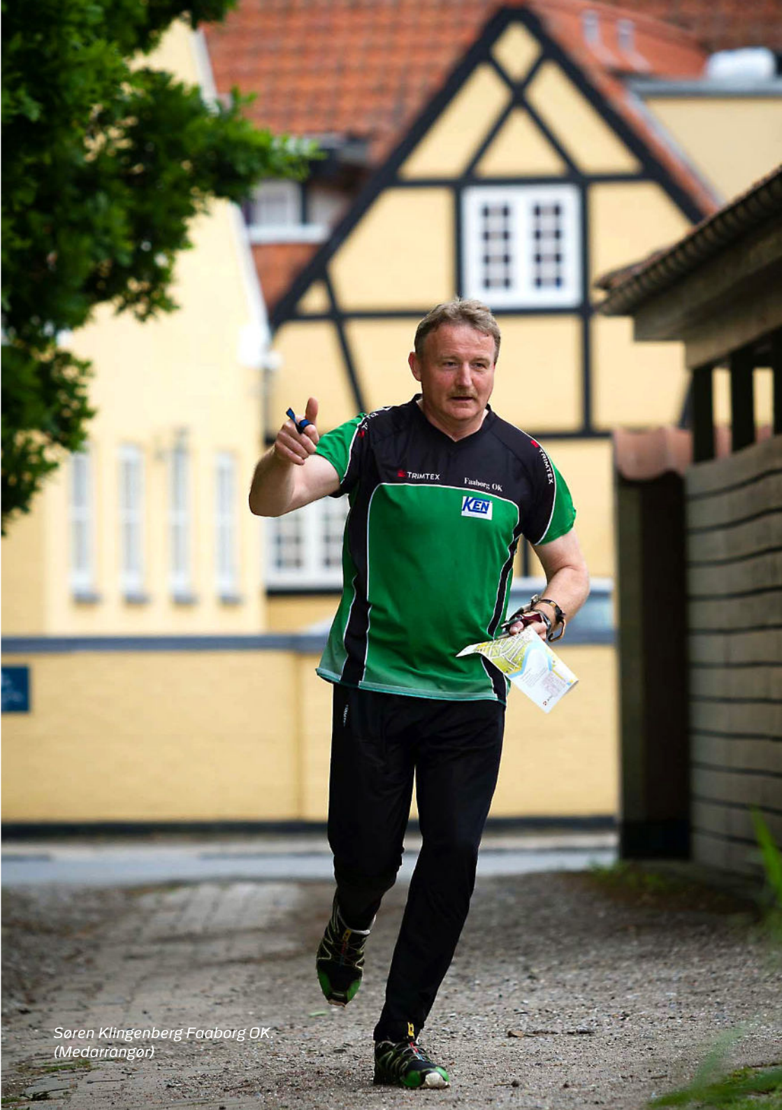
Søren Klingenberg Faaborg OK. (Medarrangør)