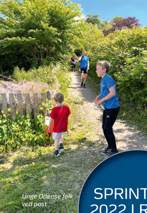
Unge Odense folk ved post