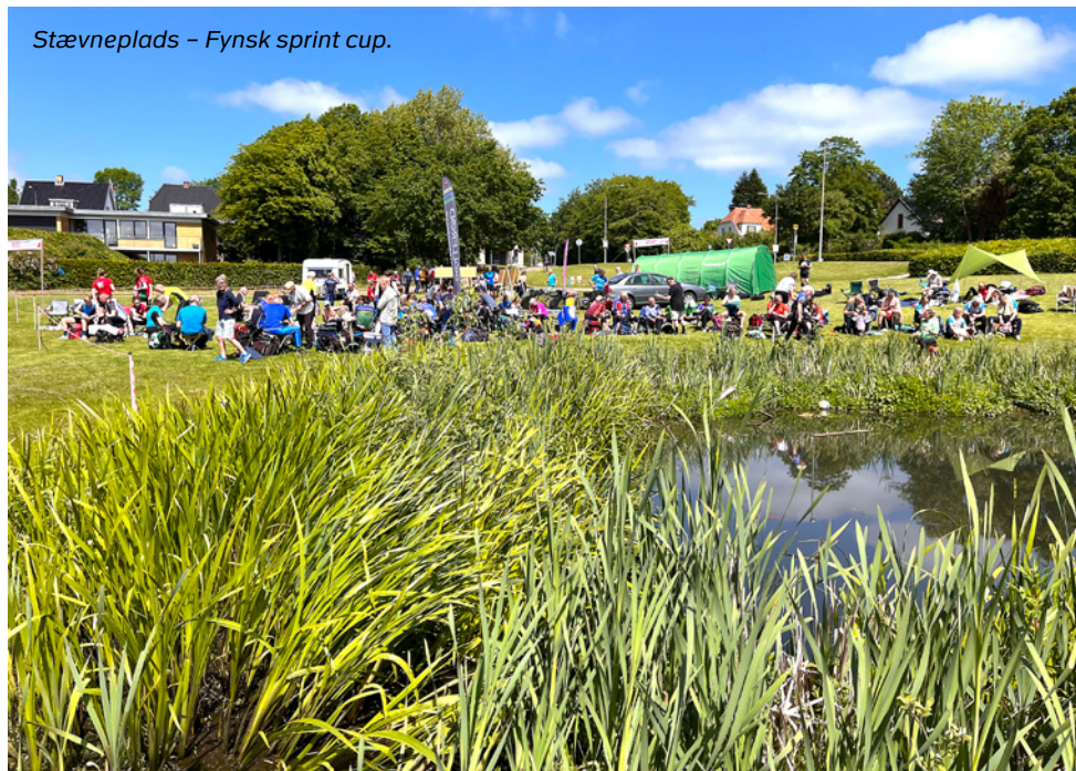
Stævneplads – Fynsk sprint cup.

at finde vej. Samtidig får man jævnligt den lykkefølelse, der ligger i at finde det, man leder efter.