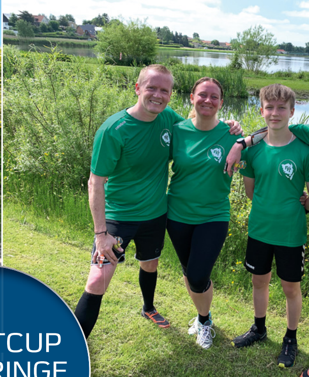
Den smukke stævneplads