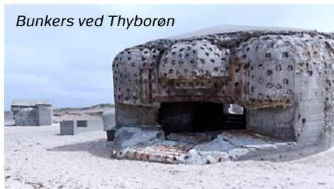
Bunkers ved Thyborøn

Under 2. Verdenskrig besluttede Adolf Hitler, at Europa skulle befæstes mod vest. Re-