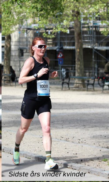
Sidste års vinder kvinder