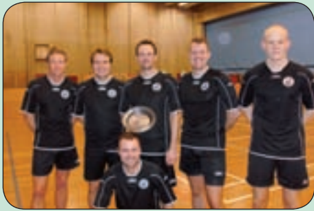
Nr. 1. St. Amager