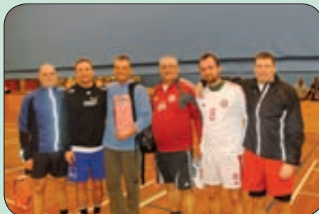
Nr. 2 OB Kbh. uddannelse