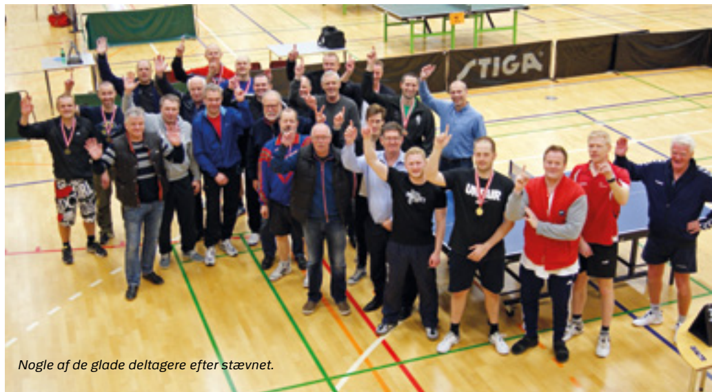
Nogle af de glade deltagere efter stævnet.