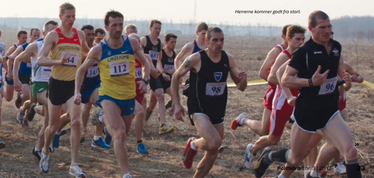
Herrerne kommer godt fra start.

Efter en mellemlanding og 3 timers ventetid i Wien, lykkedes det at nå frem til Otepeni Lufthavn i Bukarest kl. 18.00 rumænsk tid. Der var fra arrangørerne sørget for transport til hotellet, men vi kunne ligeså godt have gået, da hotellet lå meget tæt på lufthavnen. Det var efterfølgende en flok trætte løbere, der lod sig indlogere på Rin Hotel. Hotellet var nydeligt og servicen var af høj kvalitet. Det var desværre mere end man kunne sige om den mad, der blev serveret for de fremmødte løbere og delegerede fra de 22 lande, som alle var indlogeret på samme hotel, men nu er mad for sportsudøvere jo heller ikke så vigtigt..... Nå, vi fandt en løsning på mad-problemet den efterfølgende dag. »