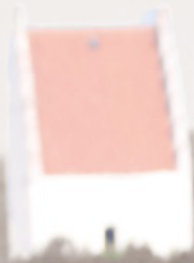
Alene på Kirkemilen.