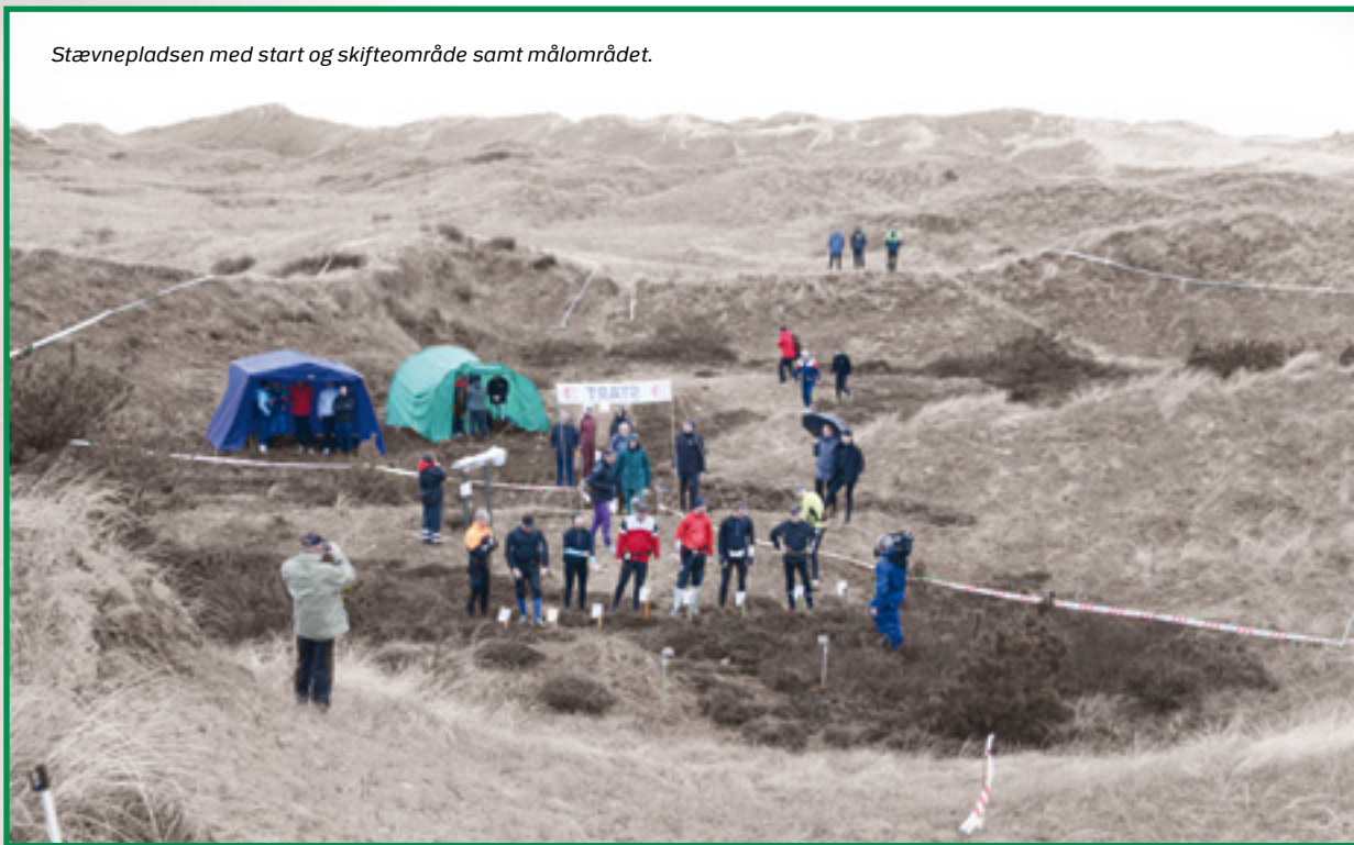
Stævnepladsen med start og skifteområde samt målområdet.