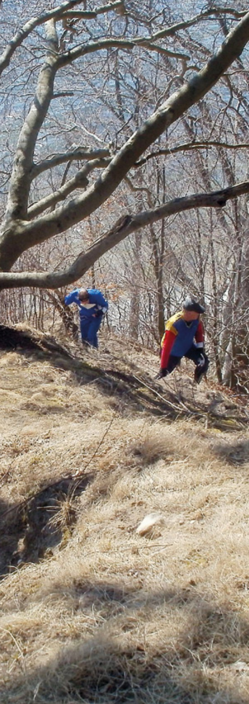
Klar til start