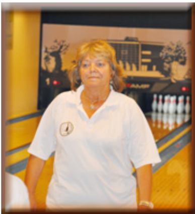
Ulla Lund, København, dansk politimester 2014