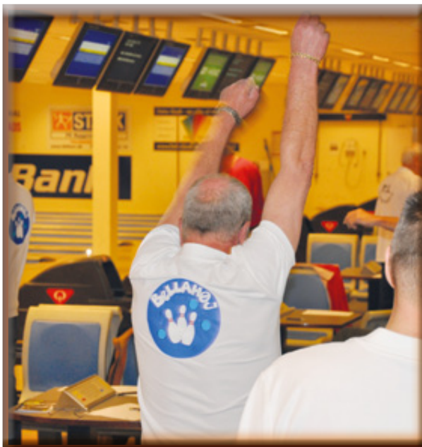
... først lidt opvarmning, og så videre til spillet