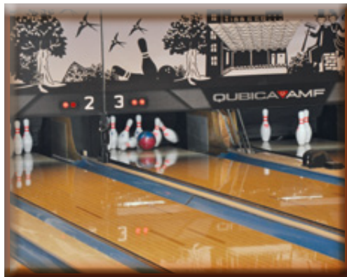
Hvad spillet drejer sig om "væltede Kegler"