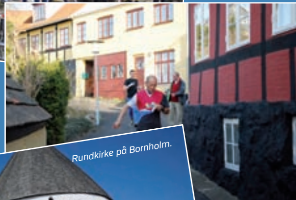
Rundkirke på Bornholm.