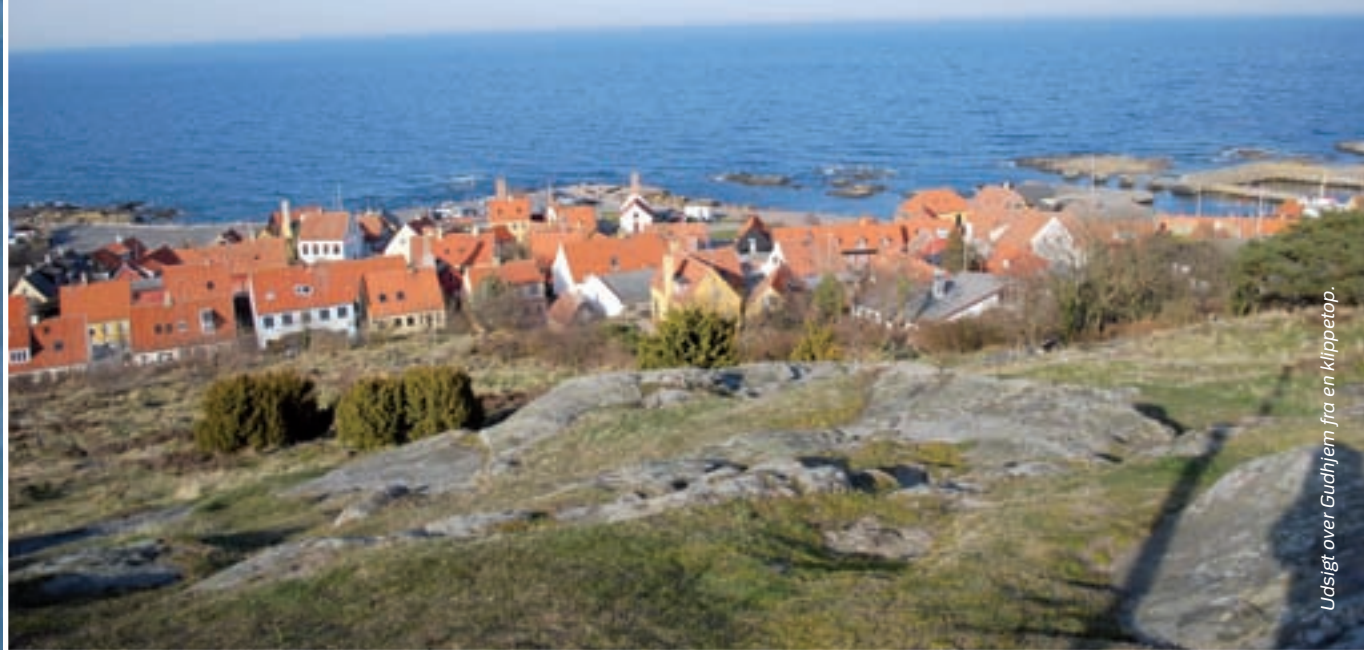
Udsigt over Gudhjem fra en klippetop.

Årets danske politimesterskaber i henholdsvis feltspor og orientering blev en kæmpe succes.