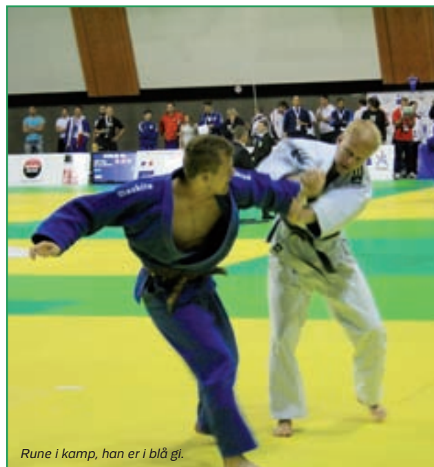
Rune i kamp, han er i blå gi.