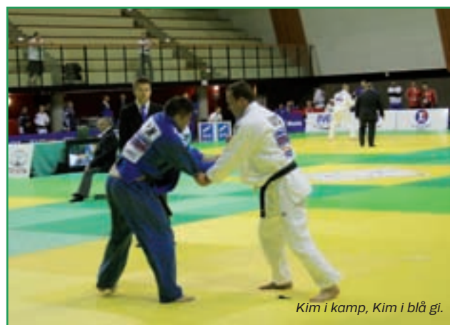
Kim i kamp, Kim i blå gi.

Da klokken var ved at være mange, og kæmperne skulle være friske til næste dag, tog kæmperne hjem, og de 2 "gamle" kiggede lidt mere på Paris – en skøn by!