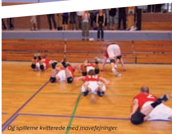
Og spillerne kvitterede med mavefejninger.