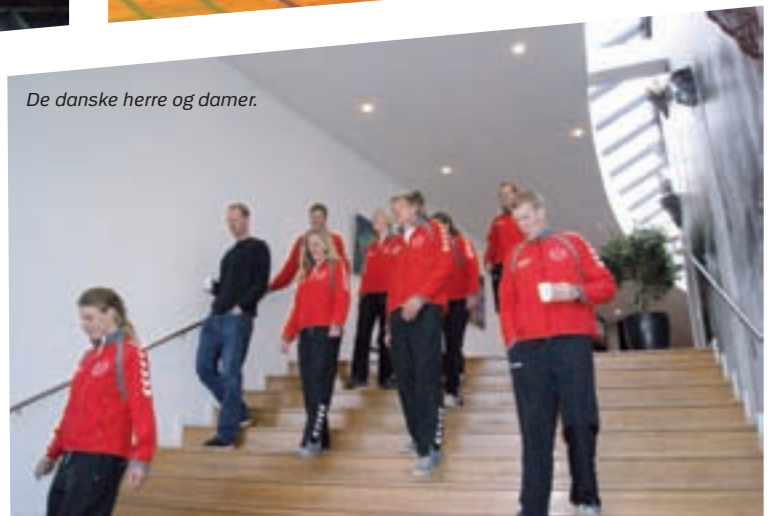
De danske herre og damer.

gen 13-14 og Finland vandt det 3. og afgørende sæt med 25-17 og dermed fortjent kampen med cifrene 3-0. Der var ingen tvivl om, at Finland havde forberedt sig godt til Mesterskabet, idet det var tydeligt, at de med deres større bredde på holdet og dermed flere strenge at spille på, var en for stor mundfuld for det danske landshold. Danmark vidste således godt, at muligheden for bevare titlen som Nordiske Mestre ikke var ret stor, da det ikke forventedes, at Norge senere på dagen ville slå Finland.