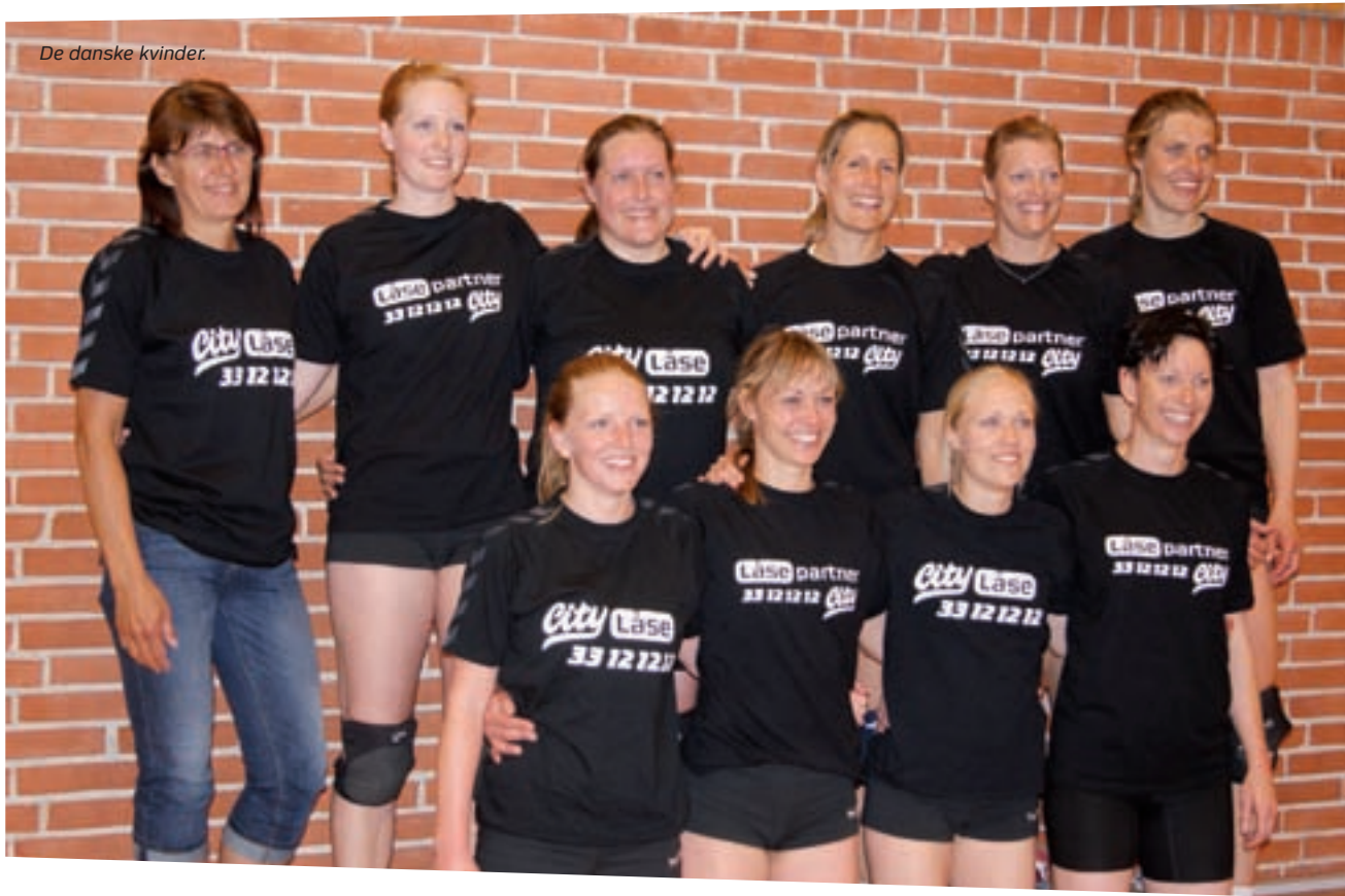
De danske kvinder.