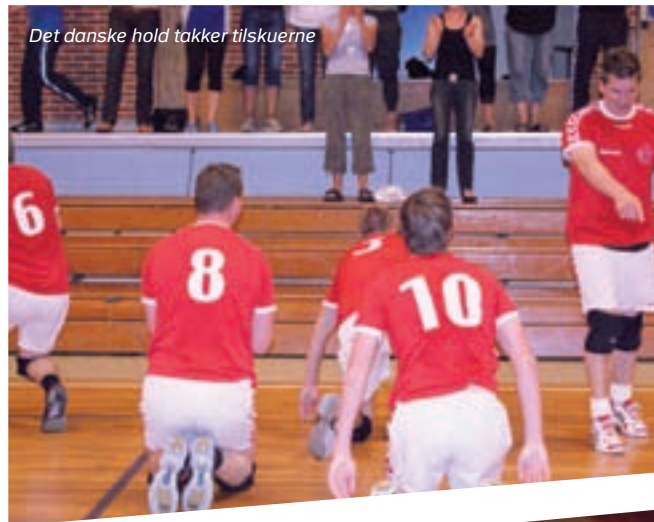
Det danske hold takker tilskuerne