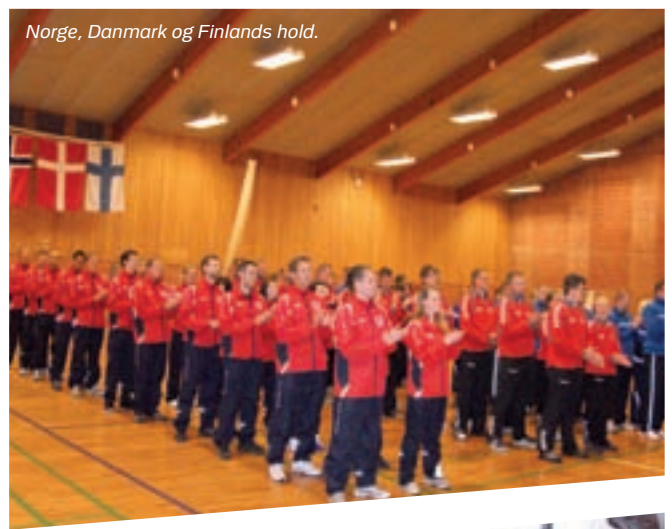
Norge, Danmark og Finlands hold.