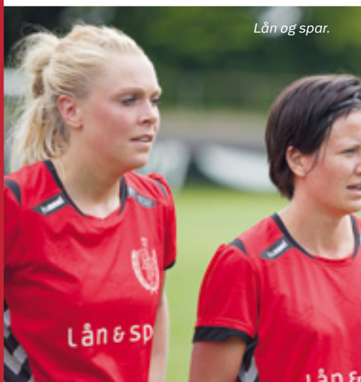
Lån og spar.