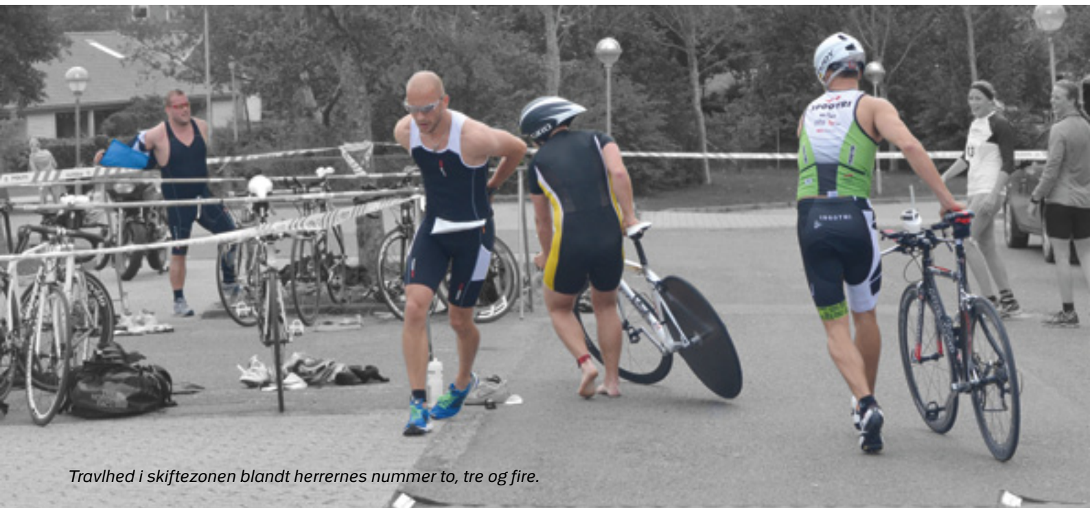
Travlhed i skiftezone blandt herrerne nummer to, tre og fire.