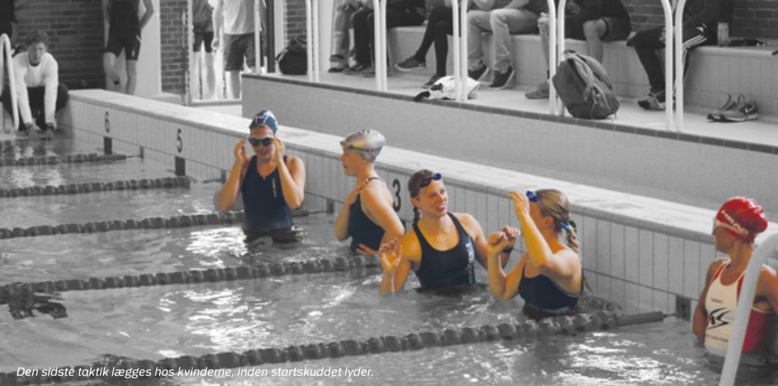
Den sidste taktik lægges hos kvinderne, inden startskuddet lyder.