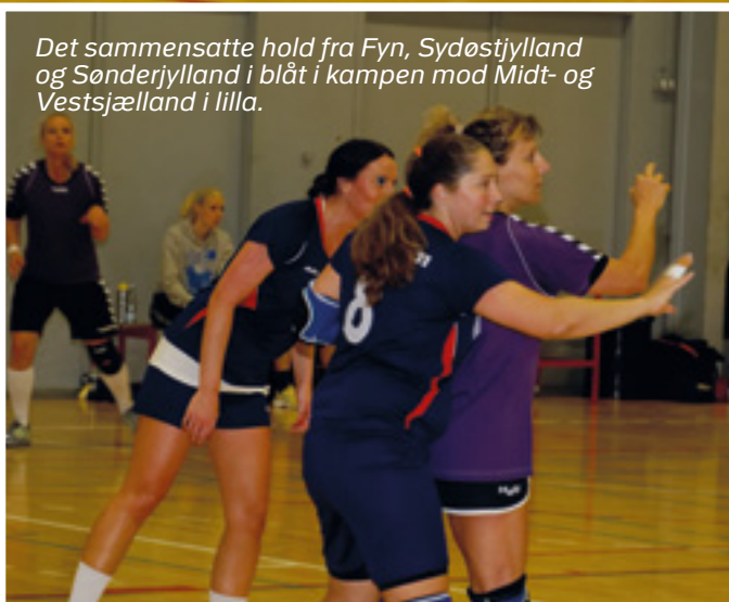
Det sammensatte hold fra Fyn, Sydøstjylland og Sønderjylland i blåt i kampen mod Midt- og Vestsjælland i lilla.