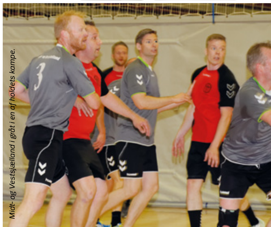
Midt- og Vestsjælland i gråt i en af holdets kampe.