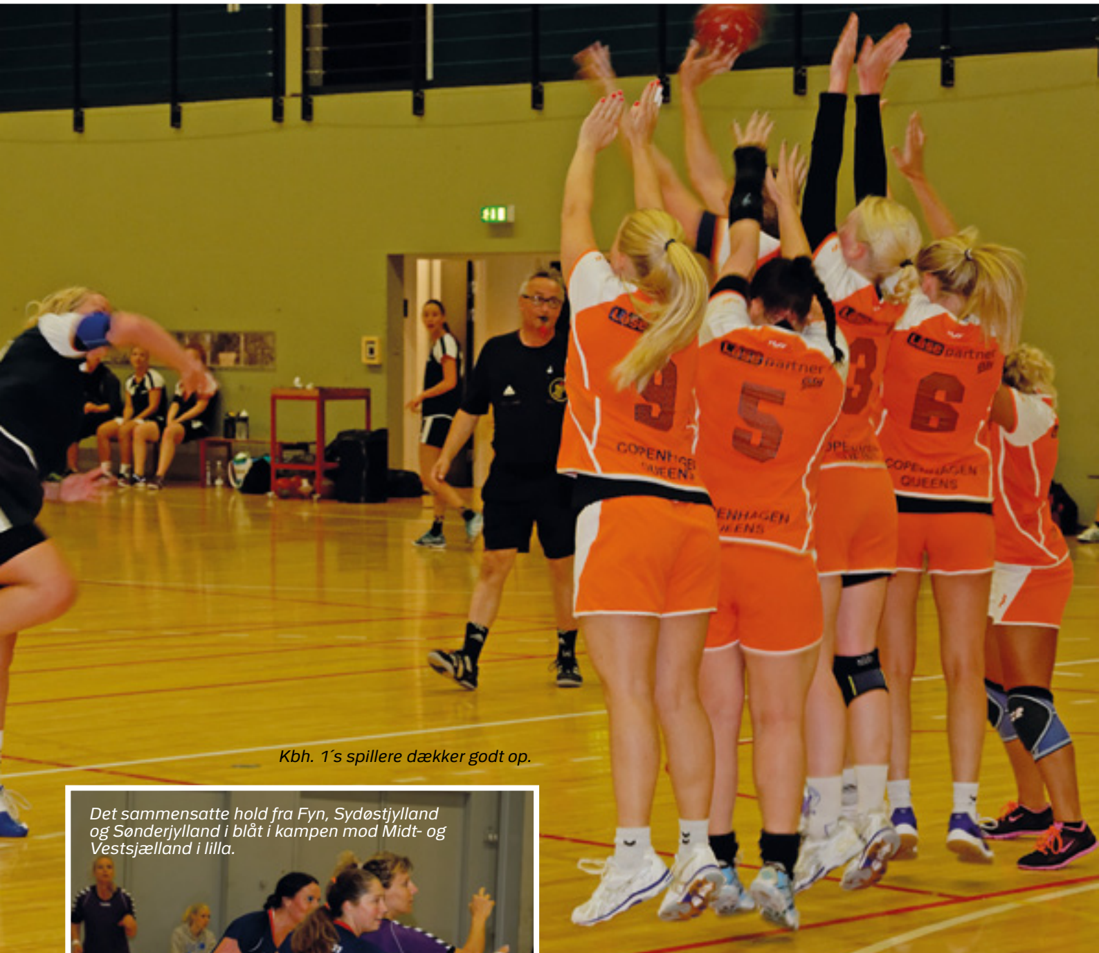
Kbh. 1's spillere dækker godt op.