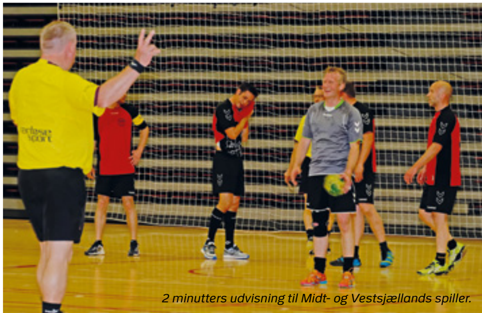
2 minutters udvisning til Midt- og Vestsjællands spiller.

Elite 1 blev åbnet af Fyn 1 og hjemmeholdet Midt- og Vestsjælland. De to hold fulgtes pænt af med skiftende føringer på 1-2 mål, til halvleg resultat 9-8 til Midt- og Vestsjælland. I anden halvleg så det ud til at Midt- og Vestsjælland trak fra og var således kort før tid foran med tre mål. For at få sejren hjem blev der brugt ufine tricks og det kostede 2 udvisninger, hvilke Fyn straks udnyttede og kampen endte 18-18.