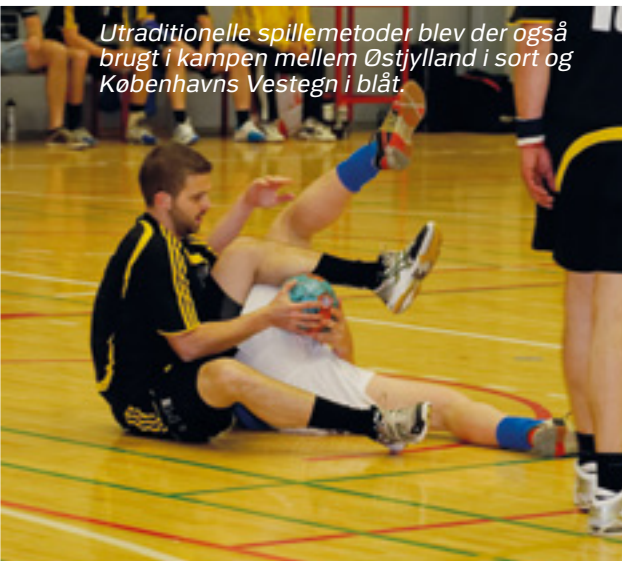
Utraditionelle spillemetoder blev der også brugt i kampen mellem Østjylland i sort og Københavns Vestegn i blå.

Kamp 2 var mellem Sydøstjylland og Kbh. Vestegn. Sydøstjylland stillede op med solidt forsvars- og målmandsspil, hvilket gav Kbh. Vestegn store problemer. Sydøstjylland øgede lige så stille føringen og kampen endte 23-16 til Sydøstjylland. Der var nu lagt op til en puljefinale mellem Østjylland og Sydøstjylland. De to hold fulgtes ad og med flere gode redninger fra Sydøstjyllands målmand kunne Sydøstjylland gå til pause med +2. Østjylland hentede forspringet i 2. halvleg og cirka halvvejs henne bragte de sig foran. Kampen endte med sejr til Østjylland på 17-15. De to semifinaler var således klar, Station City mod Sydøstjylland og Midt- og Vestsjælland mod Østjylland.