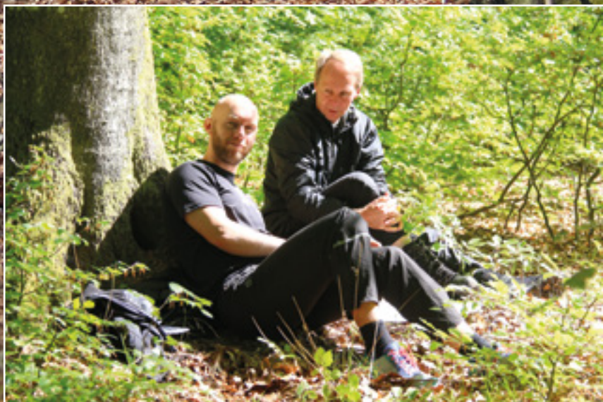
De havde dog også tid til at slappe lidt af

Herfra gik det faktisk ret godt, og på trods af en lidt ringe start, så var det en helt fantastisk dag i naturen. Efterhånden så har jeg også opnået den færdighed at vide, at når jeg