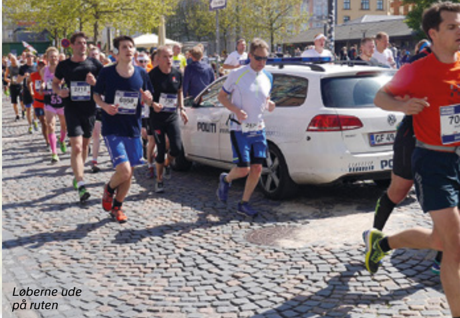
Løberne ude på ruten

Søndag den 24. maj 2015 blev de danske politimesterskaber i maraton afgjort i hjertet af København i forbindelse med Copenhagen Marathon, hvor vi var med som et lille løb i løbet. PI København Motionsafdeling stod for arrangementet. Der var i lang tid op til løbet meget få tilmeldte, men de sidste to uger kom der en del flere løbere med, så vi kom op på 41 startende løbere. Noget skuffende set i forhold til sidste års deltagerantal – men forventeligt set i forhold til det arbejdspress der har været i foråret.