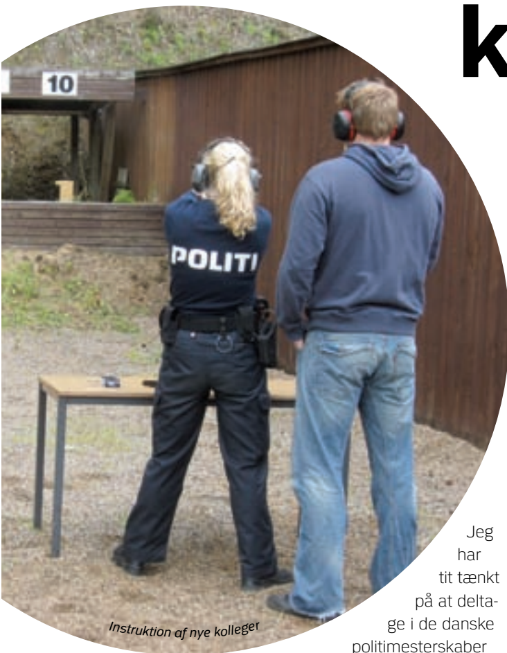
Instruktion af nye kolleger