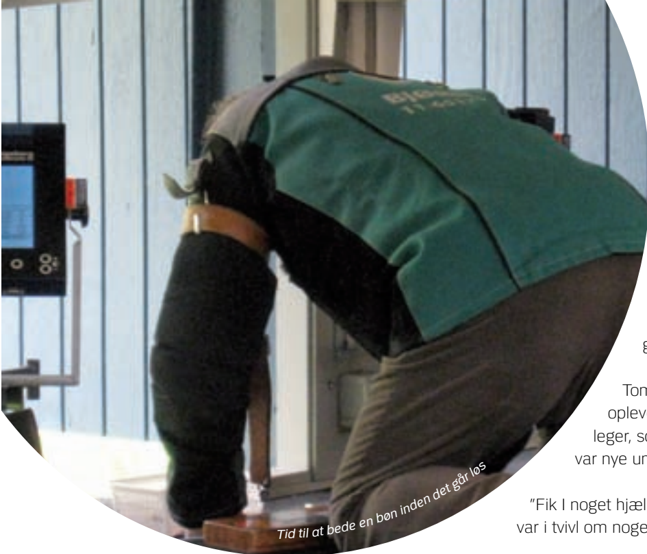
Tid til at bede en bøn inden det går løs

"Hvordan oplevede I som nye kolleger at komme ud til sådan et stævne, hvor der er mange garvede og rutinerede kolleger?"