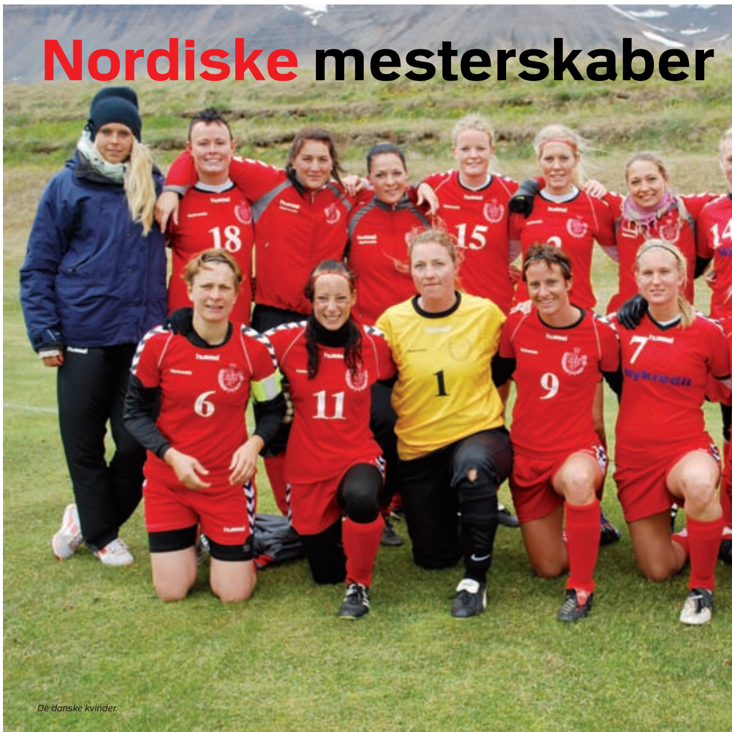
De danske kvinder.