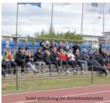
Solid opbakning fra damelandsholdet.