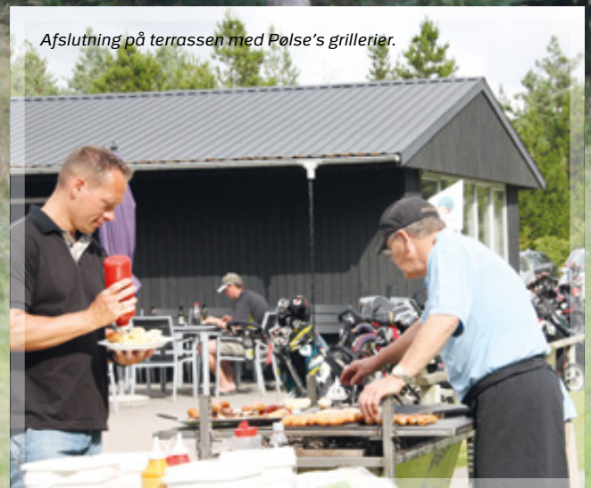
Afslutning på terrassen med Pølse's grillerier.