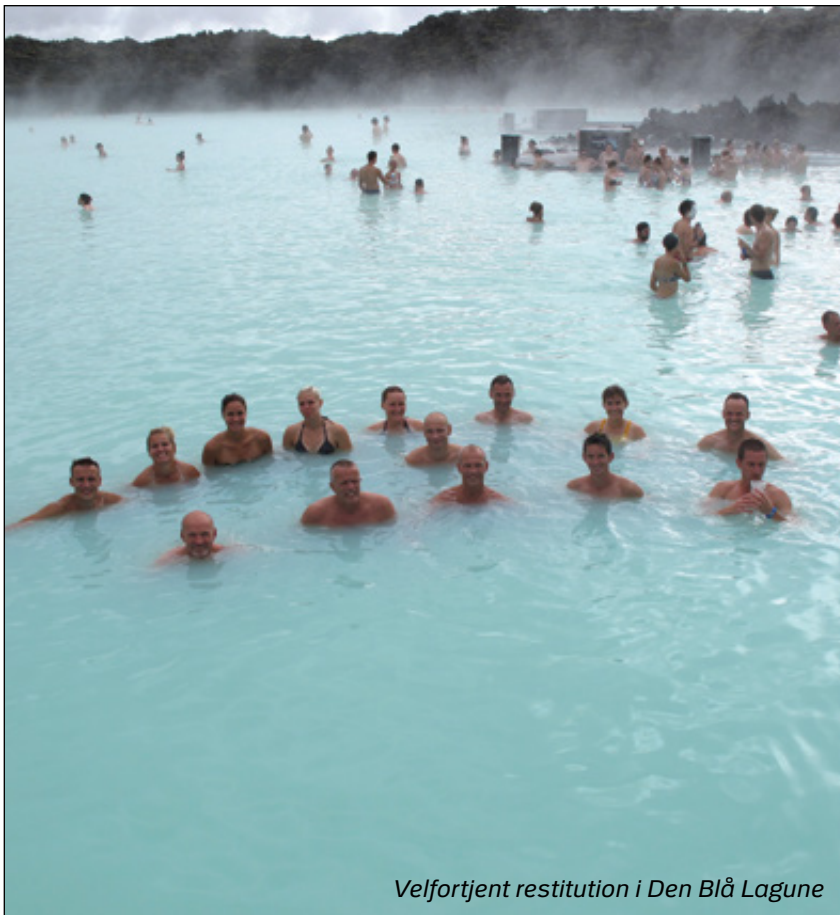
Velfortjent restitution i Den Blå Lagune