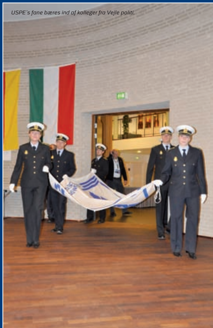
USPE's fane bæres ind af kolleger fra Vejle politi.