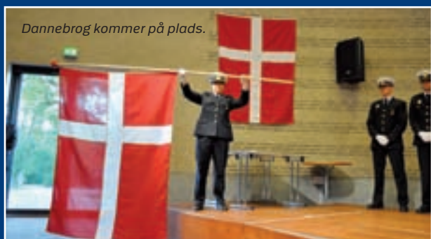
Dannebrog kommer på plads.