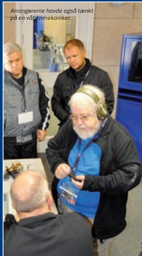
Arrangørerne havde også tænkt på en våbenmekaniker.