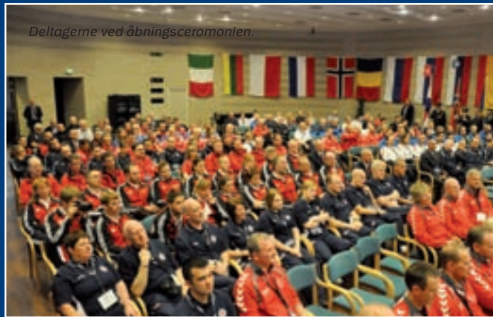
Deltagerne ved åbningsceremonien.