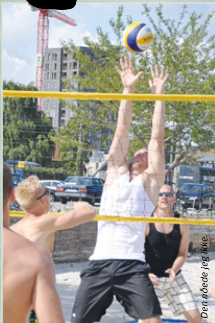
Den nåede jeg ikke.