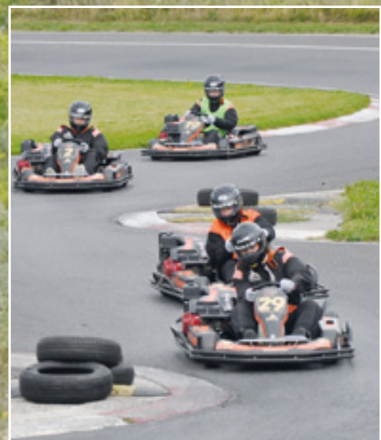
Mig kommer du ikke forbi.