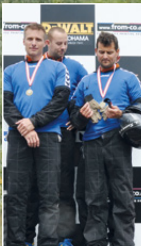
Nr. 3 Curb Riders.