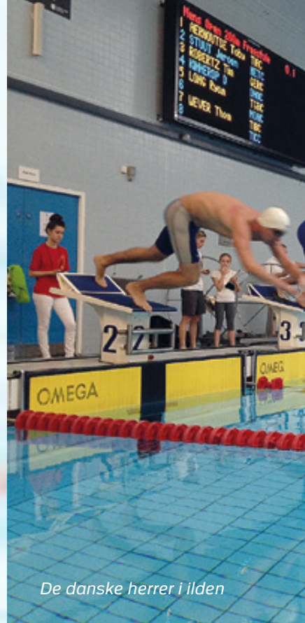
De danske herrer i ilden