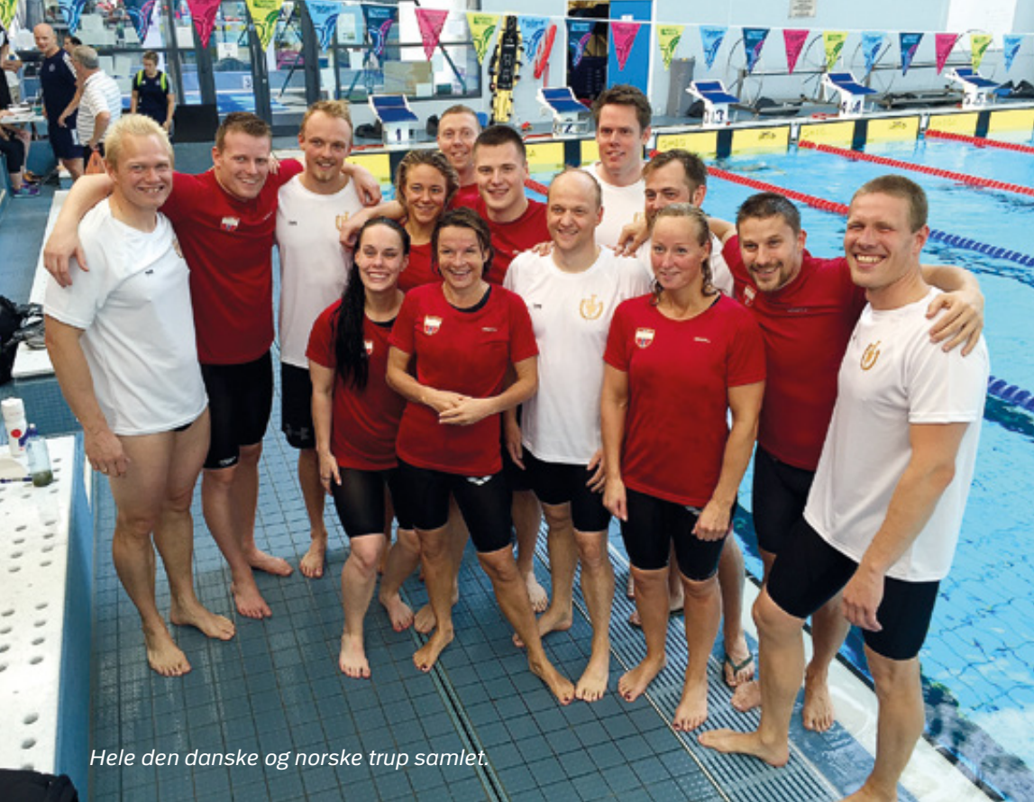
Hele den danske og norske trup samlet.