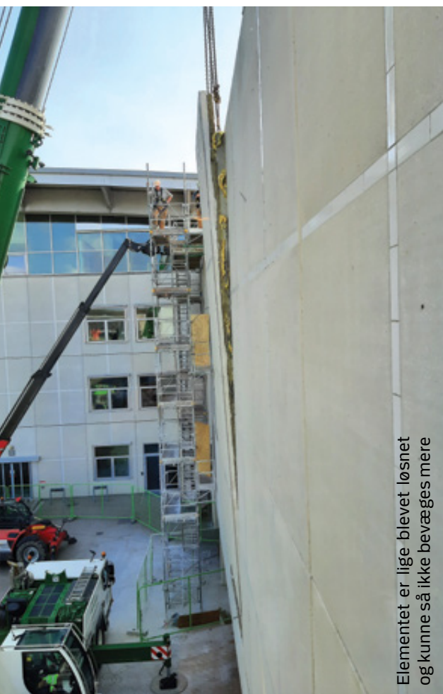
Elementet er lige blevet løsnet og kunne så ikke bevæges mere

og kranen kunne løfte det ud. Efterfølgende blev elementet lagt på en blokvogn. Med millimeter nøjagtighed placerede kranføreren elementet præcis på blokvognens lad, og kort efter endnu et element, hvorefter blokvognen kørte væk.