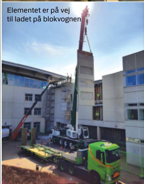
Elementet er på vej til ladet på blokvognen