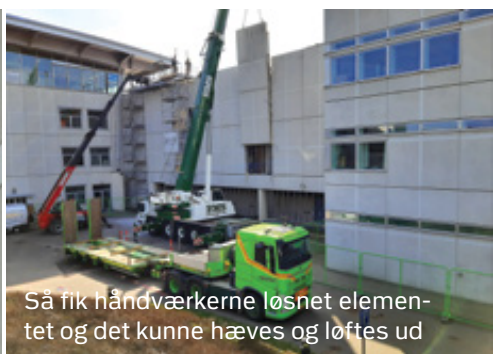
Så fik håndværkerne løsnet elementet og det kunne hæves og løftes ud