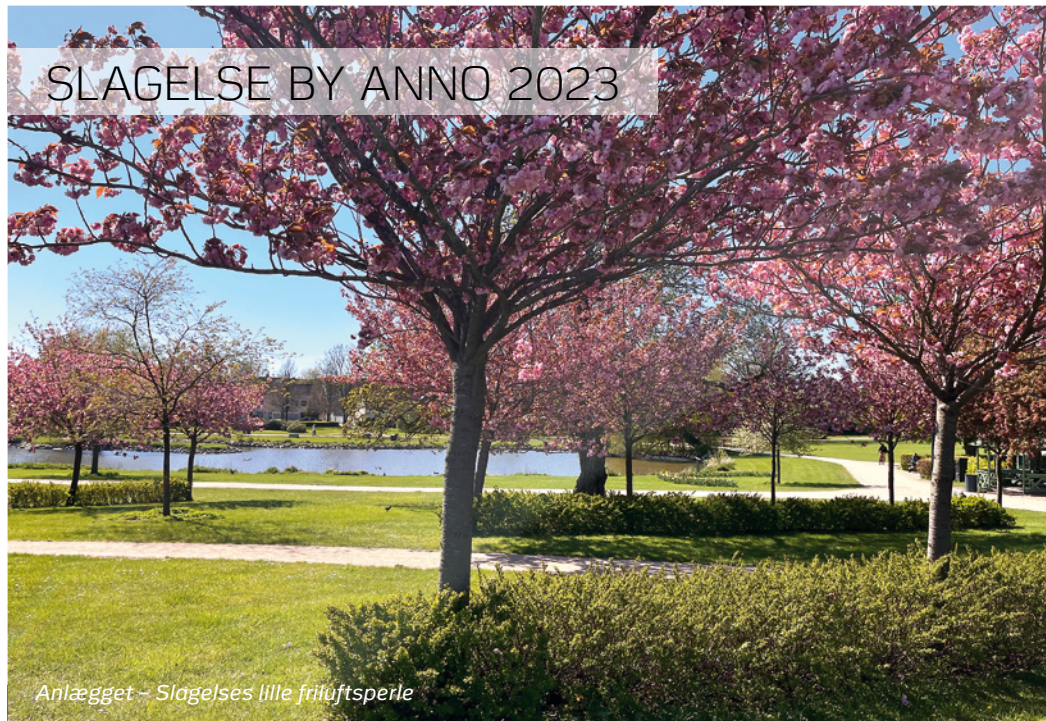
Anlægget – Slagelses lille friluftspejle