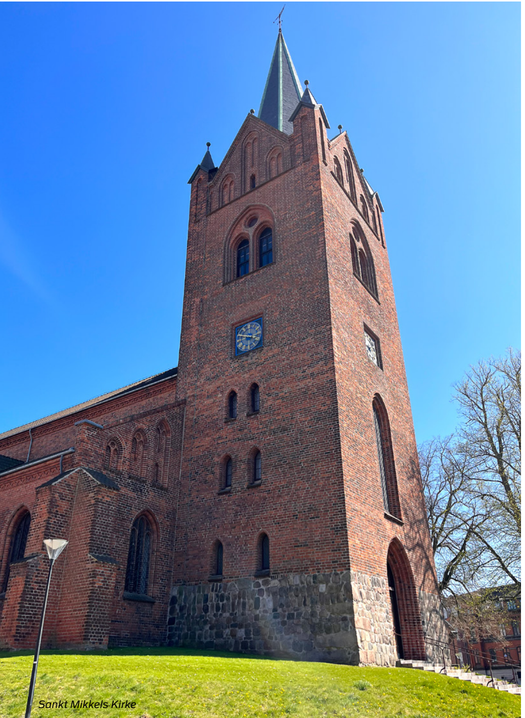
Sankt Mikkel's Kirke