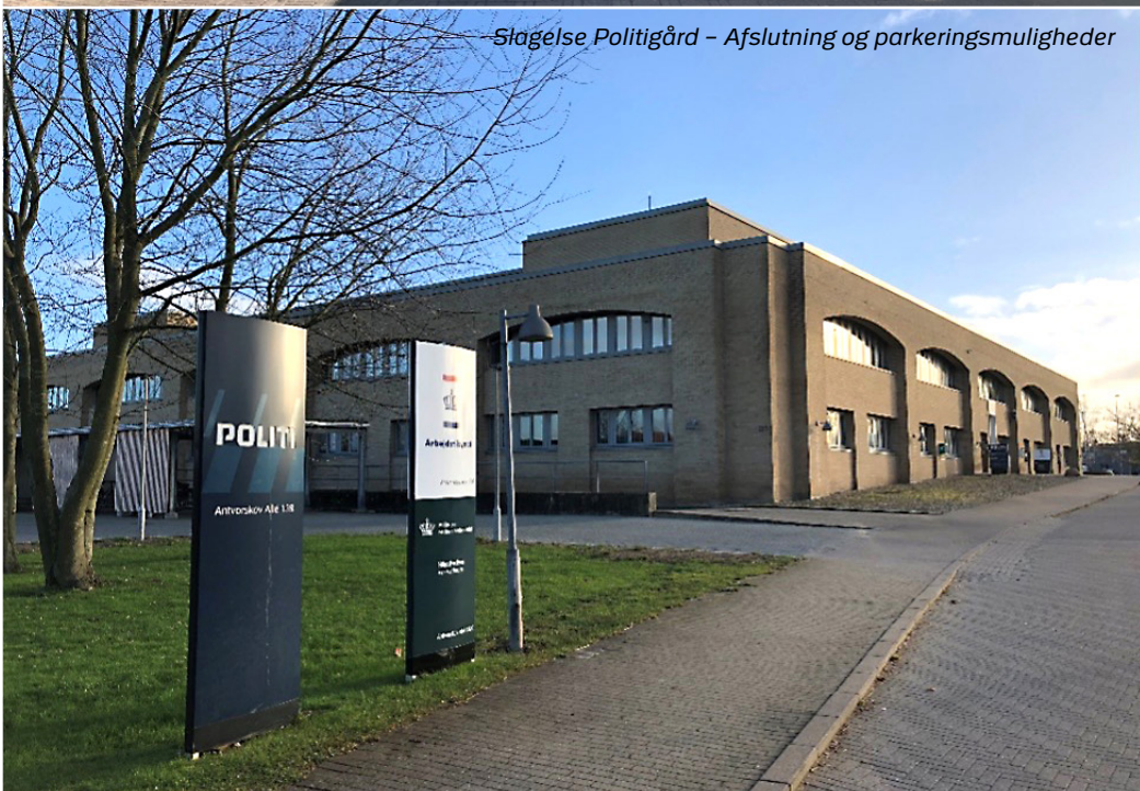
Slagelse Politigård – Afslutning og parkeringsmuligheder