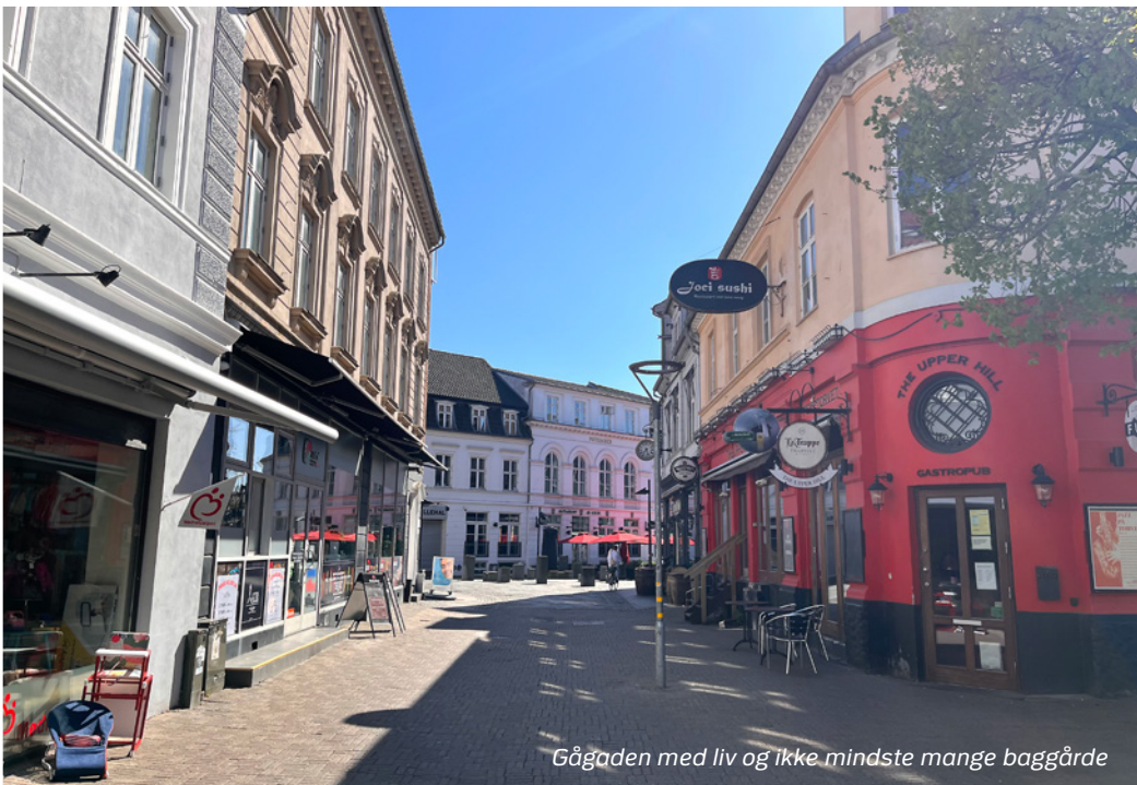
Gågaden med liv og ikke mindste mange baggårde