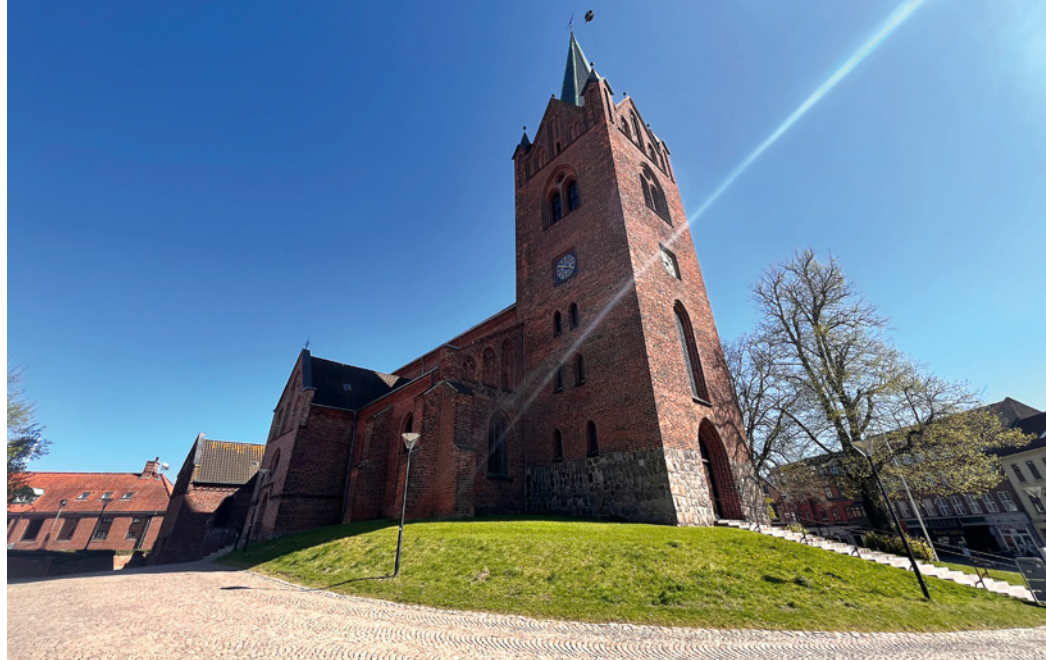
Skt. Mikkel Kirke – en af byens "højde" punkter