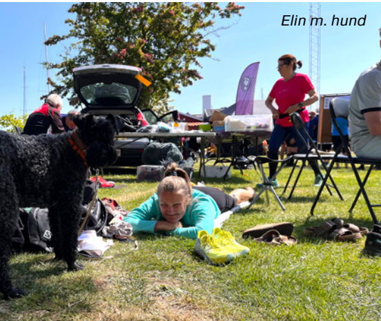
Elin m. hund