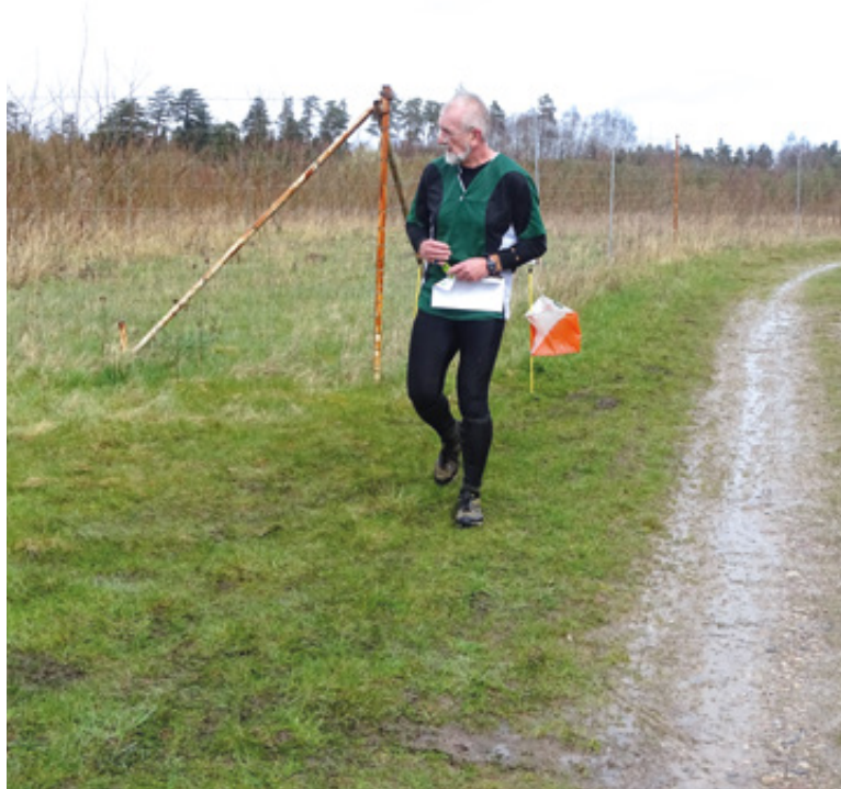
Arkivfoto: Albaniløbet 2016