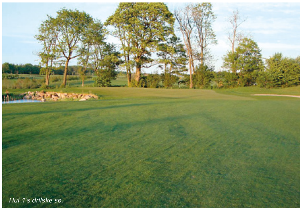
Hul 1's drilske sø.