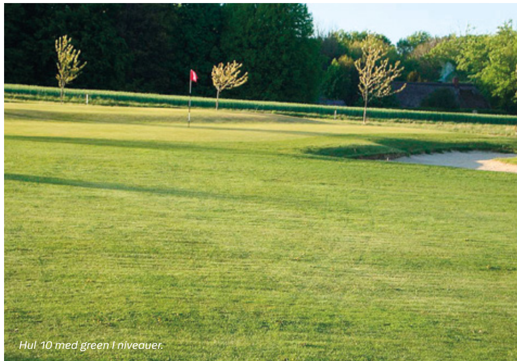
Hul 10 med green I niveauer.