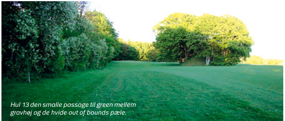
Hul 13 den smalle passage til green mellem gravhøj og de hvide out of bounds pæle.