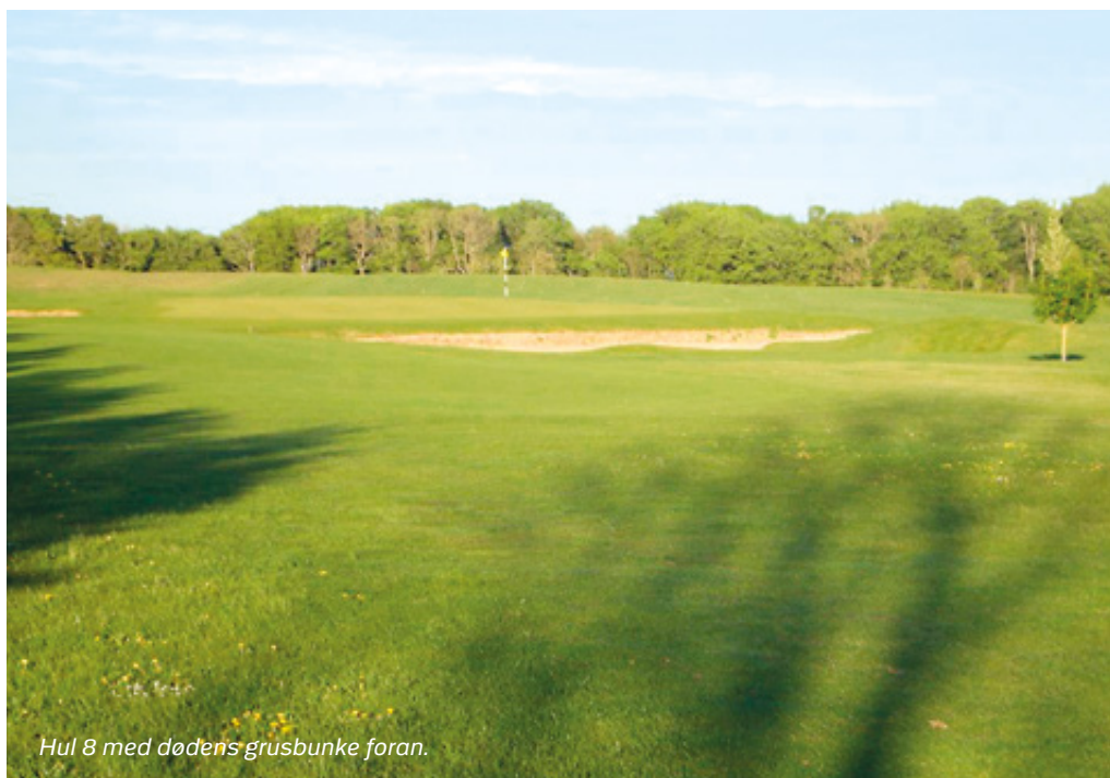
Hul 8 med dødens grusbunke foran.