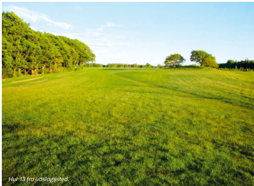
Hul 13 fra udslagssted.