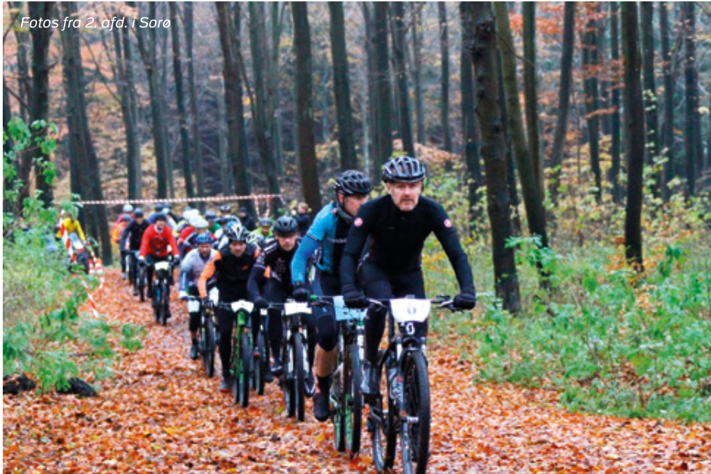
Fotos frá 2. afd. í Soró