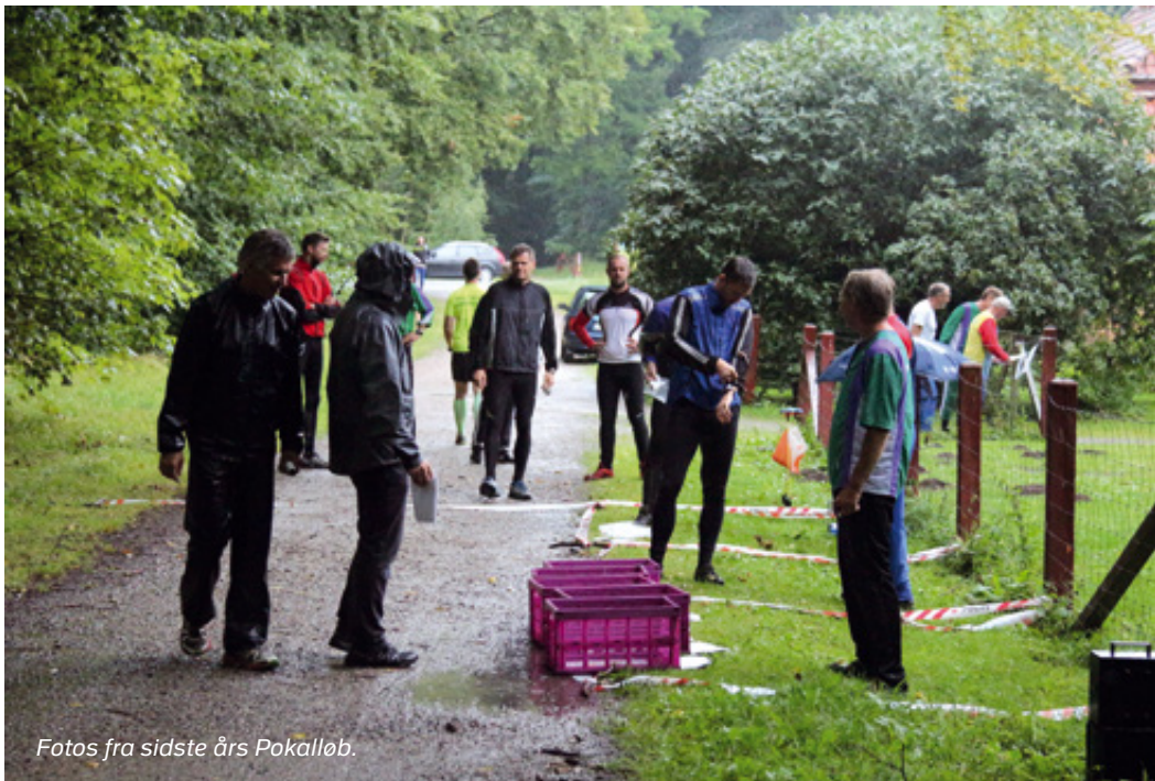
Fotos fra sidste års Pokallob.

TERRÆN Let kuperet med stejlere skrænter på den østlige og sydlige side. Blandet vegetation. Generelt god gennemløbelighed.