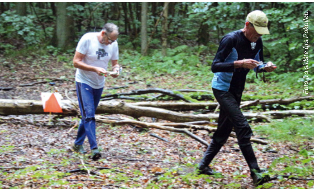
Foto fra sidste års Pokalløb.

Der findes ved Krogemosen en bålplads, som stilles til fri afbenyttelse. Herudover er der et veludbygget net af ridestier. Ridning er ikke tilladt på skovvejene. Skoven er udlagt som B-skov (beskyttet skov). Det betyder, at der normalt ikke gives tilladelse til arrangementer, som vil kunne forstyrre dyrelivet eller skovgæster, der vil nyde en stille skovtur.