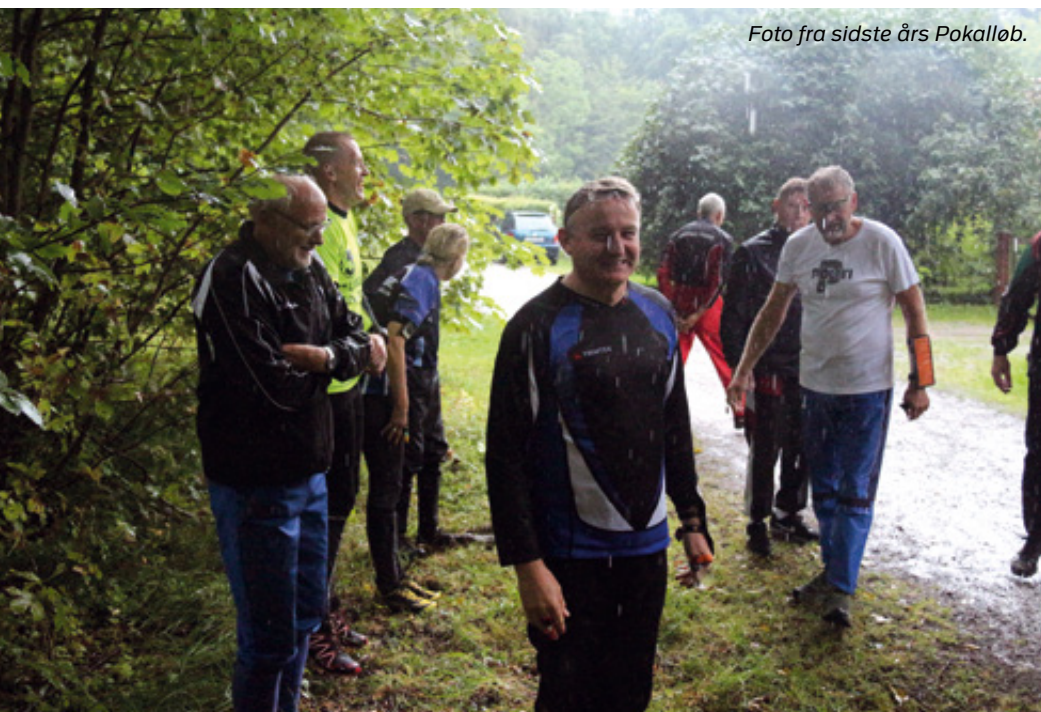
Foto fra sidste års Pokalløb.